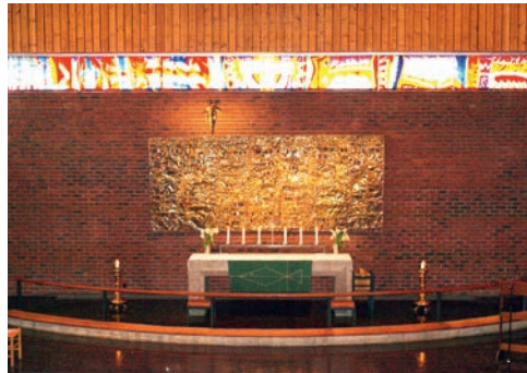
TORSHOV OG LILLEBORG MENIGHET Lilleborg kirke, Oskar Braatens gate 35, 0474 Oslo post.torshovlilleborg.oslo@kirken.no

Kirken.no/tol Facebook Torshov og lilleborg menighet Telefon: 23 62 92 10 Telefon og besøkstid: hverdag 10-14