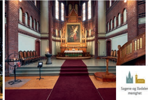
SAGENE OG ILADALEN MENIGHET Sagene kirke, Dannevigsgate 17, 0463 Oslo Post.SageneogIladalen.oslo@kirken.no Kontor/Besøksadresse: Ila kirke,

Søren Jaabækgate 5, 0460 Oslo Man/ons/torsdag 10-14, tirs 12-14 kirken.no/sageneogiladalen Facebook Sagene kirke/Ila kirke