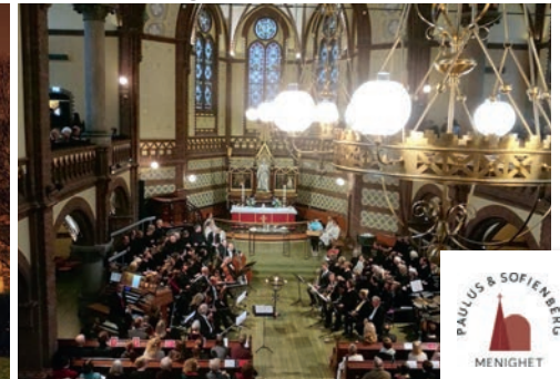
PAULUS OG SOFIENBERG MENIGHET Menighetskontor Helgesens gate 64, 0558 Oslo post.paulussofenberg.oslo@kirken.no Paulus kirke ligger ved Birkelunden.

Kirken.no/ps Facebook Paulus og Sofienberg menighet Telefon 23 62 92 50 Telefon- og besøkstid: Tir-fre 10-14