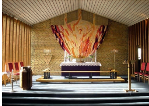
HASLE MENIGHET Eindrives vei 9, 0575 Oslo post.hasle.oslo@kirken.no Kirken.no/hasle

Facebook Hasle kirke Telefon: 23 62 97 60 Telefon- og besøkstid: Man-tor 10-14