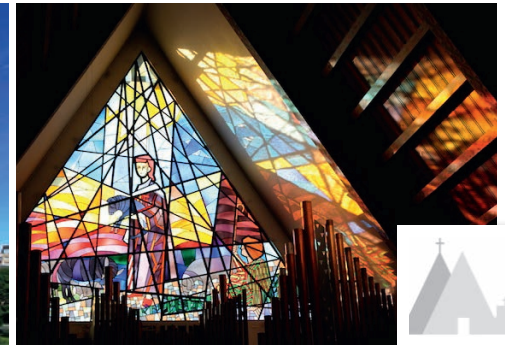
Torshov kirke (restaureres-gjenåpning høsten 2020), Åsengata 19, 0480 Oslo Torshov og Lilleborg menighet post.torshovlilleborg.oslo@kirken.no

Kirken.no/tol Facebook Torshov og Lilleborg menighet Telefon: 23 62 92 10 Telefon og besøkstid: hverdag 10-14