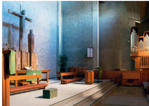
SINSEN MENIGHET Lørenveien 13, 0585 Oslo post.sinsen@oslo.kirken.no Kirken.no/sinsen

Facebook Sinsen kirke Telefon: 23 62 97 60 Telefon- og besøkstid: Man-tor 10-14