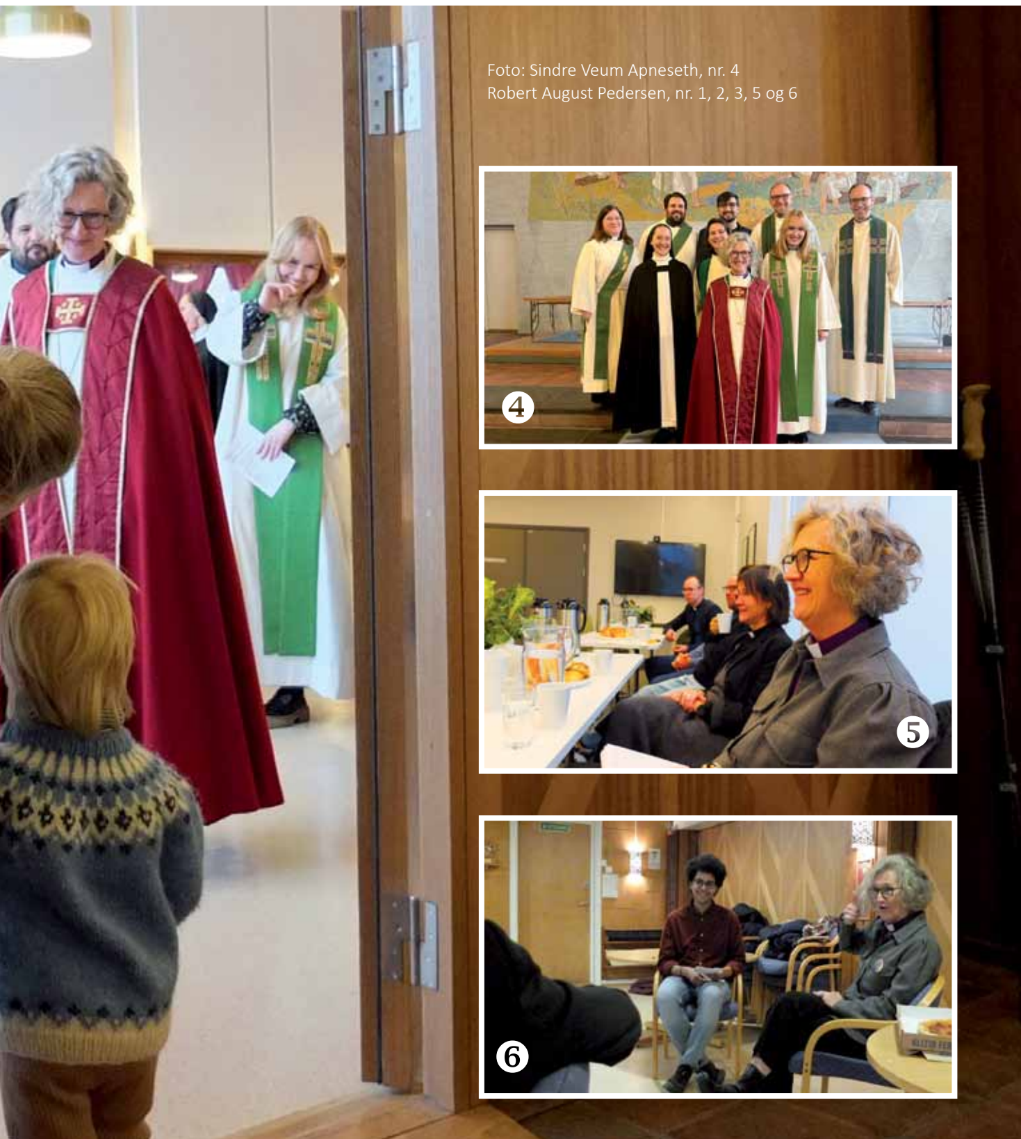
Foto: Sindre Veum Apneseth, nr. 4 Robert August Pedersen, nr. 1, 2, 3, 5 og 6