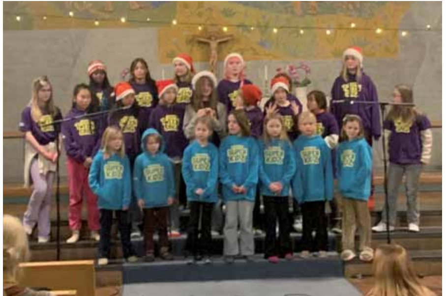
Fra korets semesterkonsert 6. desember.

Superkidz og TweenSing er menighetens korttilbud for barn i alderen 6 til 12 år og er et lavterskeltilbud med fokus på musikkglede og samhold. Korene er åpne for alle. Det er ingen opptaksprøve.