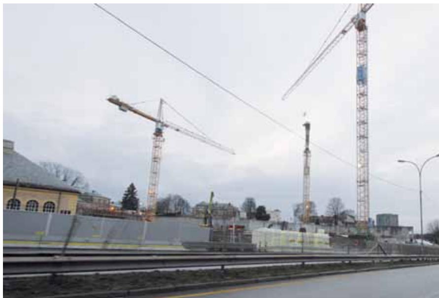
Storbylegevakten reiser seg.