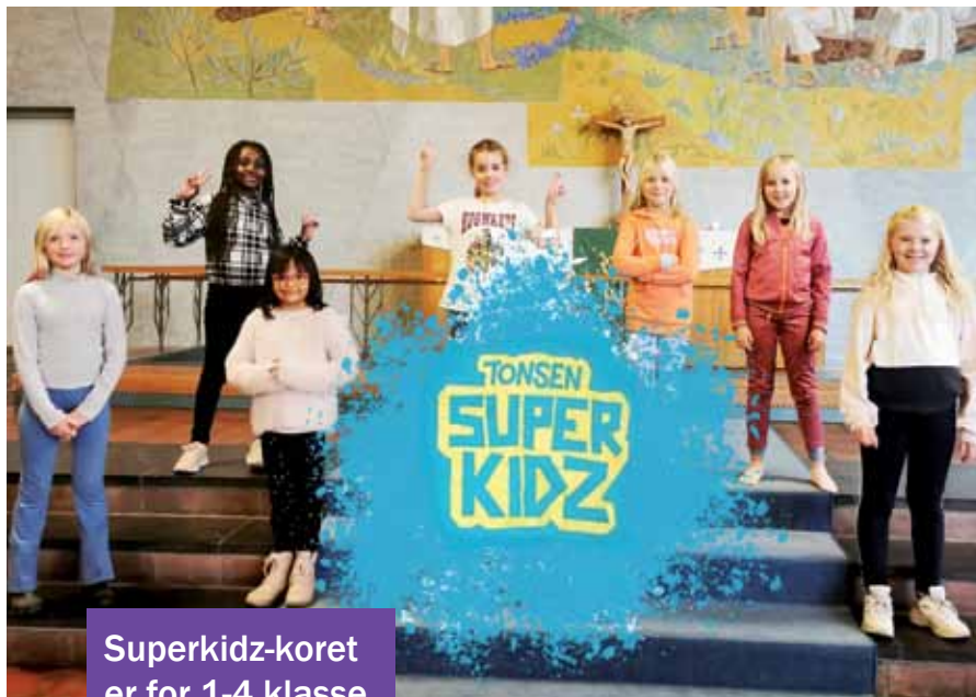
Superkidz-koret er for 1-4.klasse

Hvis du har vært på en familiegudstjeneste i Tonsen har du antagelig hørt Superkidz synge så taket løfter seg!