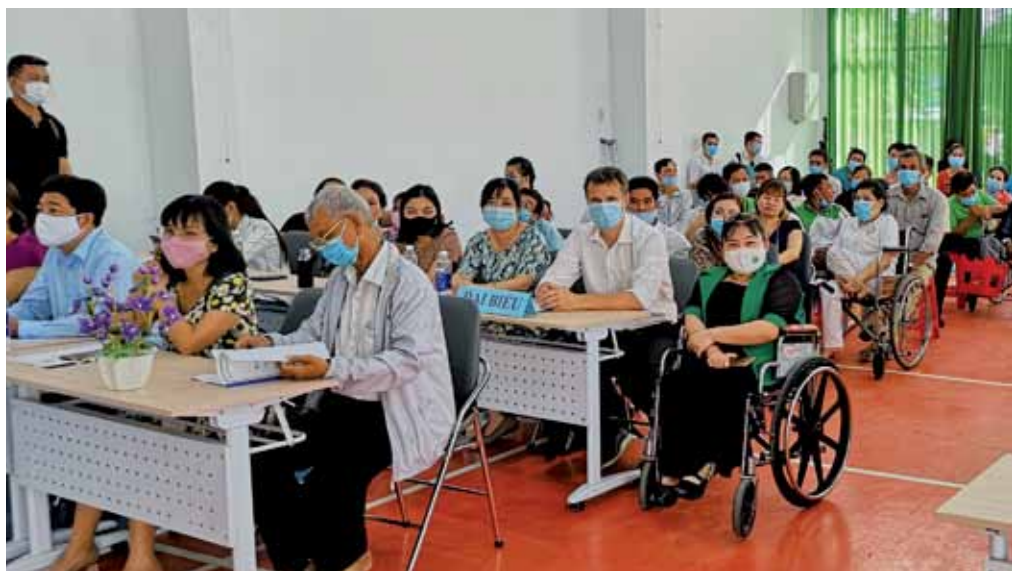
4 smittede i Ho Chi Minh og alle tar på seg maske. Effektive tiltak har gjort at Vietnam er et av landene i verden med færrest koronasmittede. Bildet er fra feiringen av den internasjonale dagen for funksjonshemmede.

Fordi smittevernet har vært så bra har våre aktiviteter i felt stort sett gått som vanlig. Sammen med partnere har Misjonsalliansen gjennomført klimatrening for tusenvis av kvinner, bønder og skoleelever. Vi har styrket og utvidet vårt arbeid for å inkludere barn med funksjonshemninger i skolen og vi har trent mange hundre kvinner i entreprenørskap og forretningsdrift. Et nytt område vi vil jobbe mer med er hvordan vi kan hjelpe bønder til å få bedre betalt for det de dyrker. Dette er et viktig klimatiltak fordi avlingene