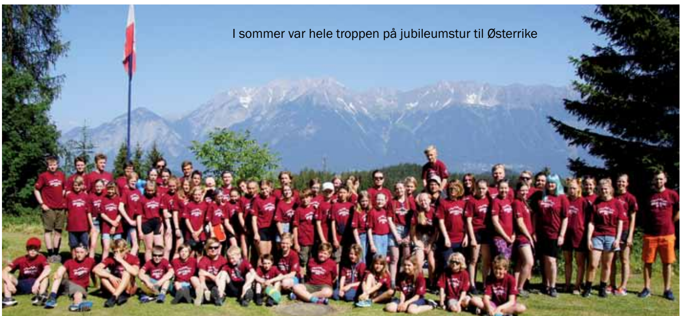
I sommer var hele troppen på jubileumstur til Østerrike

Når man har holdt på i 100 år, rekker det jo ofte å oppstå noen tradisjoner, og sånn er det også for 7. Oslo. Hver sommer og romjul drar