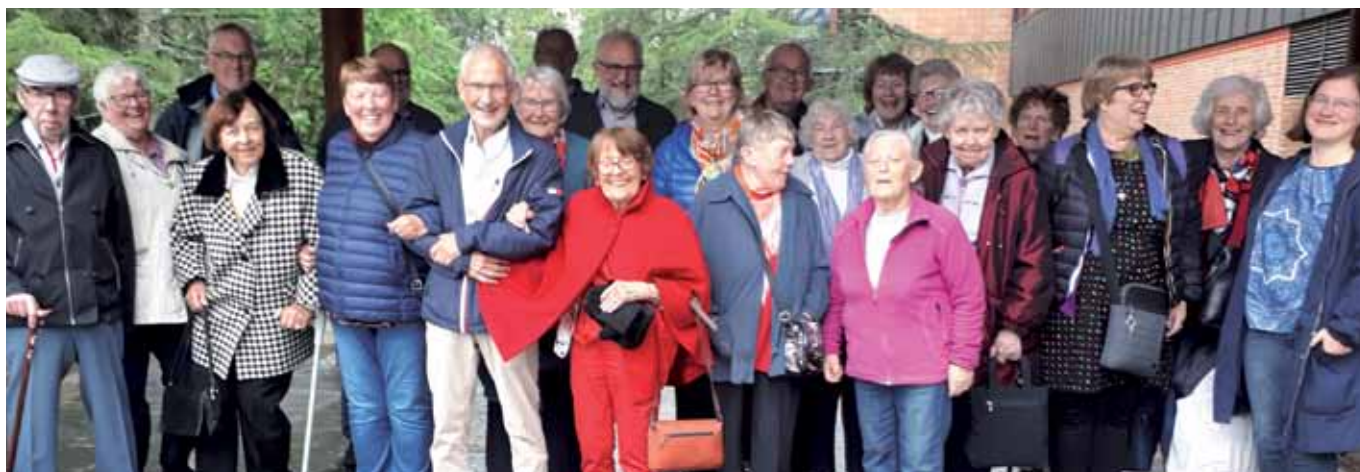
Deltakere på «Gi og få en dag» 1. juni 2019 utenfor Soria Moria. (Tidligere publisert på klubbens Facebookside).

i forbindelse med sammenslåingen av de to klubbene, satset de litt ekstra for å markere sin tilstedeværelse i bydelen. En halv million kroner ble gitt bort. Formålene som støttes er mange, men de har et særlig blikk for fritidsaktiviteter som gir tilbud til ungdommer, slik som musikkorps og idrettslag.