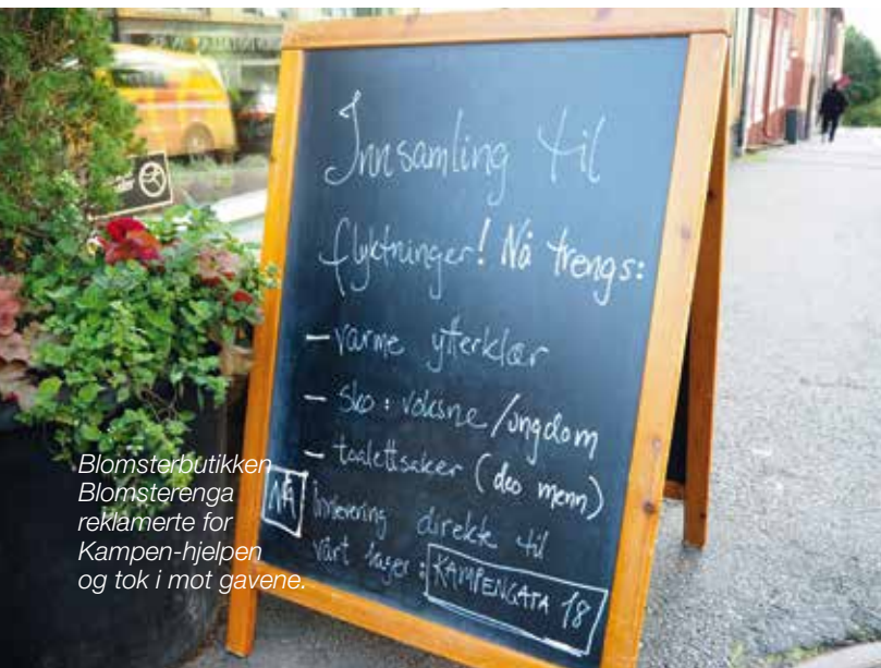
Blomsterbutikken Blomsterenga reklamerte for Kampen-hjelpen og tok i mot gavene.