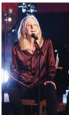
Overraskelsesgjester i Jul i Briskeby - fra v. Erik Fosnes Hansen, Kristin Asbjørnsen, Sondre Bratland og Anne Grete Preus.