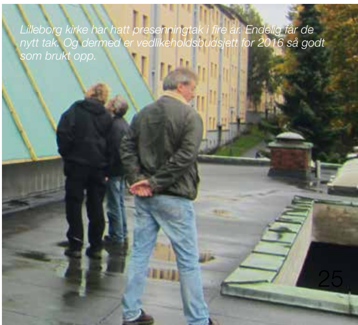
Lilleborg kirke har hatt presenningtak i fire år. Endelig får de nytt tak. Og dermed er vedlikeholdsbudsjett for 2016 så godt som brukt opp.