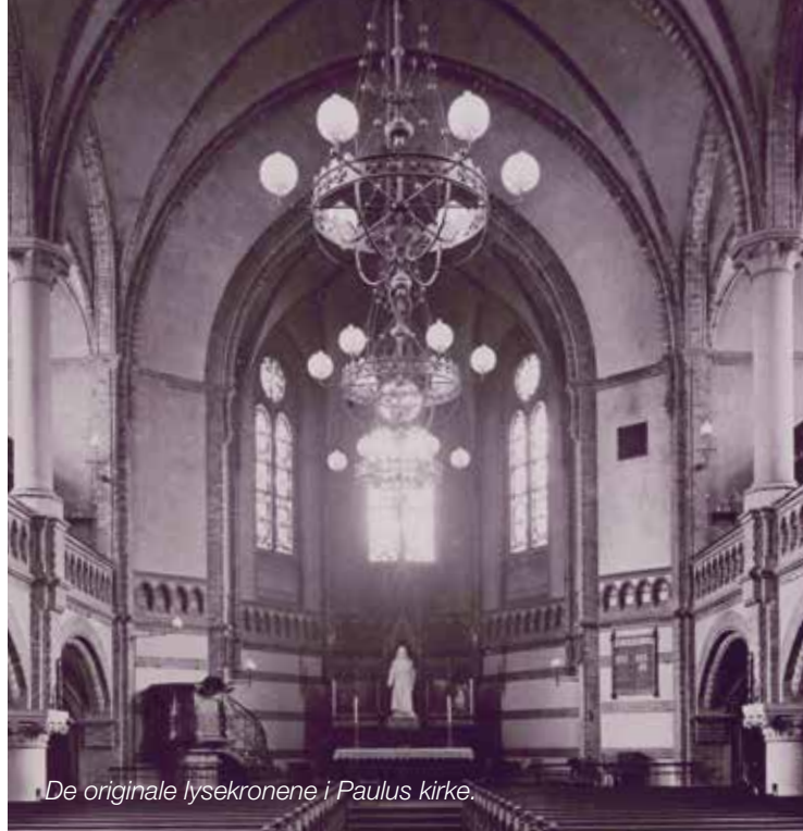
De originale lysekronene i Paulus kirke.

Det vil bli lagt inn leddlys i de nye gamle lysekronene som kommer til Paulus. Og julen 2016 blir Paulus gjenåpnet etter to års restaureringsarbeid. Da gleder vi oss til å la lysekronene skinne over menigheten og Oslos nye praktkirke.