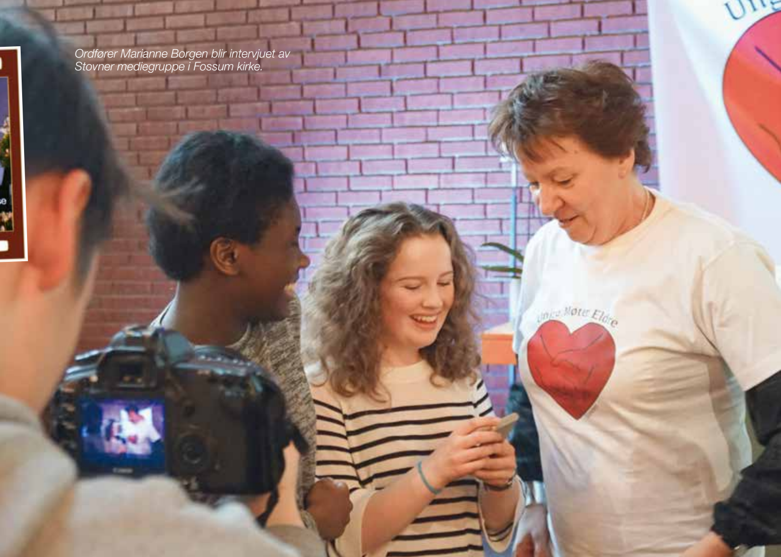
Ordfører Marianne Borgen blir intervjuet av Stovner mediegruppe i Fossum kirke.