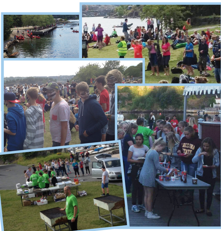
Bilder fra konfirmasjonsleieren i Kragerø.

Dette er noe jeg anbefaler alle foresatte å bli med på, det er en billig ferie for familien og du får så utrolig mye tilbake på det personlige planet. Fine boforhold er det også.