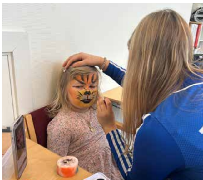
Ansiktsmaling er alltid populært på Barnefestivalen