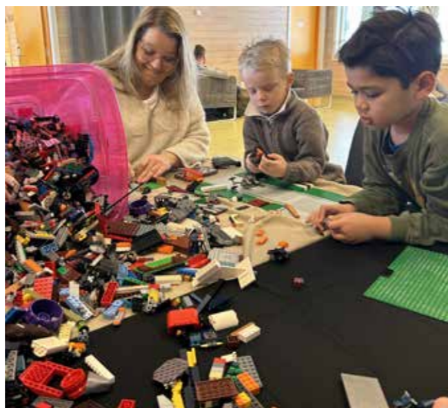
Legobygging i ungdomsavdelingen er gøy