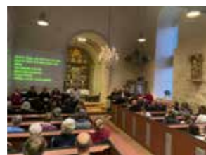
Forsangergruppen hadde øvd inn mange salmer med Maria som tema.