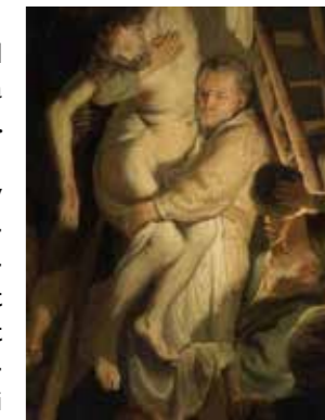
Nedtakelsen fra korset (utsnitt Josef fra Arimatea løfter Jesus). Rembrandt, 1612

Kroppen til Jesus blir tatt ned fra korset av Josef fra Arimatea sammen med disipler og Maria.