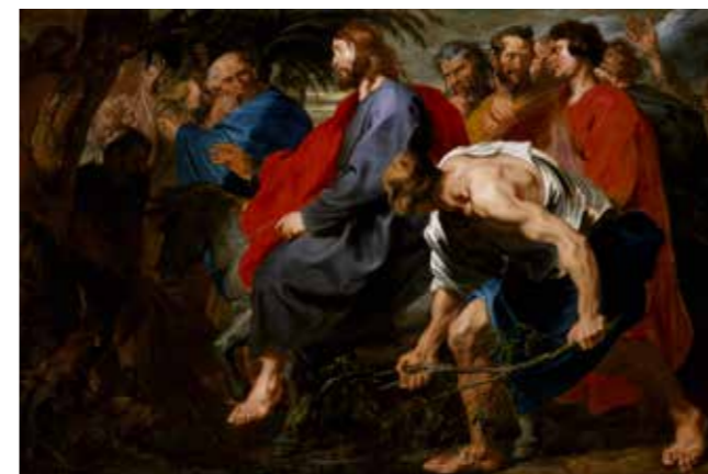
Jesus rir inn i Jerusalem. Anthony van Dyck, 1617

Kongen kommer! Palmesøndag er full av forventning og glede. Overalt kryr det av folk i Jerusalems gater. Alle vil få et glimt av han som kommer. Jesus kommer ridende på et esel inn i Jerusalem. Folk svaier med palmegrener og legger fine tepper på veien. «Velsignet være han som kommer, kongen i Herrens navn. Fred i himmelen og ære til Den høyeste».