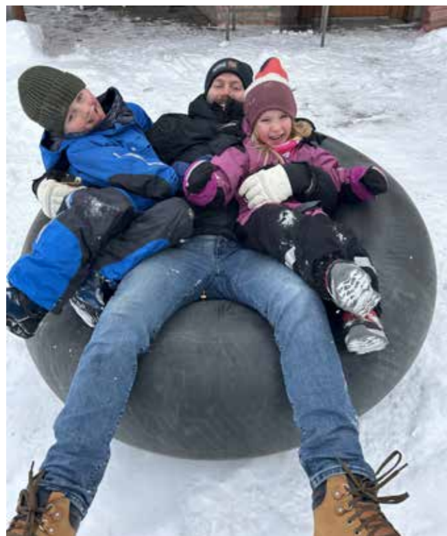
Aking bak Bygdestua er gøy for store og små.