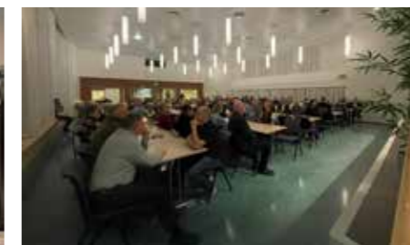
Topp stemning og fullt hus i storsalen på Bygdestua på frivillighetfest.