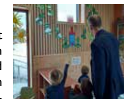
Her viser barna tegninger de har laget.

Nordli barnehage tok godt imot biskopen. I tre kvarter gikk han rundt i barnehagen og snakket med mange barn. Barna flokket seg om ham der han kom. At vi har en barnekjær biskop, er den ingen tvil om.