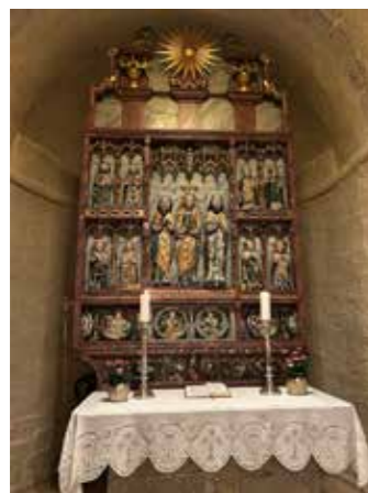
Maria-altertavla i Balke kirke feirer 500 års jubileum i år.