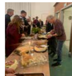
Ansatte hadde bakt kaker til de frivillige i menighetene.

De fem menighetene i Østre Toten er svært heldige som har mange frivillige. Over 300 personer var invitert, og 140 møtte opp på Bygdestua. Gospelensemblet Marmor deltok