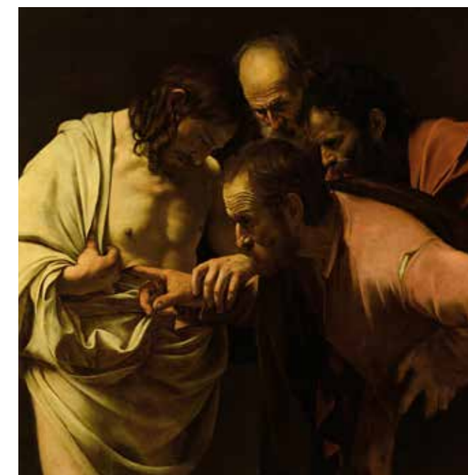
Tvileren Thomas. Caravaggio, 1601