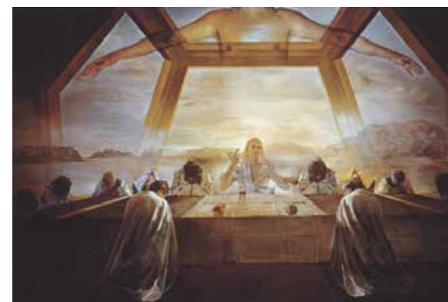
Nattverden. Salvador Dalí, 1955

Jesus feirer det siste avskjedsmåltidet sammen med de tolv disiplene. De deler den første nattverden, og Jesus vasker disiplenes føtter. En handling som peker på at han representerer en Gud som bøyer seg ned i støvet for å løfte opp det han har skapt i sitt eget bilde: mennesket. Skjærtorsdag er starten på kirkens gudstjeneste. Det er her Jesus for første gang tar et brød og løfter vinen og sier at det er hans kropp og blod.