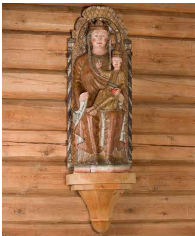
Madonna og barnet henger i Vallset kirke som fyller 175 år i år.

Du ser på meg blidt og stille – da undres jeg over at ord som Angsten og Hatet og Hevnen er kjent av noen på jord.