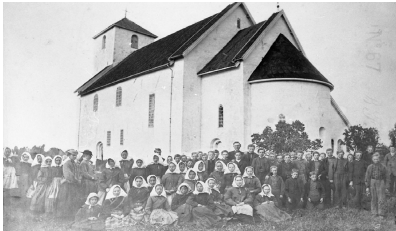
Fotografi av kyrkja med konfirmantkullet frå 1861 eller 1862. Legg merke til glasa i skipet. Dei vart endra ved restaureringa i 1894/95

Nå blir Hoffkjørkja pussa opp, og det er ikkje fyrste gongen. Kjørkja har gått gjennom store og små endringar gjennom si levetid. Her er nokre døme: