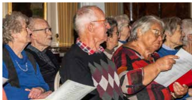
Det var folksamt i stuene på prestegarden.