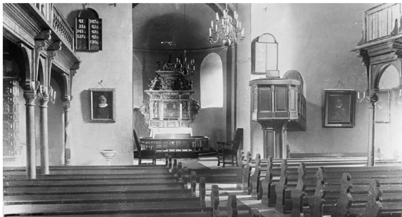
Interiøret i kyrkja fotografert i 1895, etter restaureringa. Det er galleri både på nordveggen og sørveggen. Dei nye galleria går nesten fram til korveggen. Bilda av prestane er ramma inn og hengt opp på muren under galleria. Preikestolen er flytt nærare kordøra. Legg merke til omnen som har eit attmura Mariaalter bak seg.