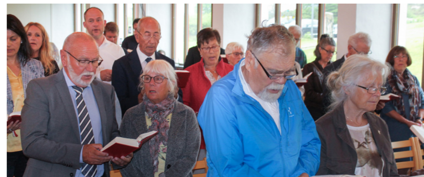
Det var godt oppmøte på gudstenesta.