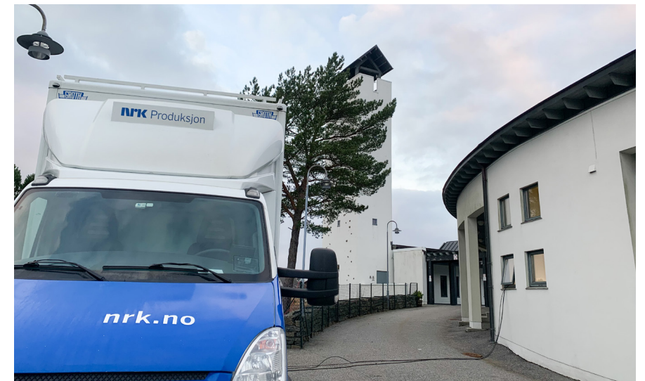
Det er mykje som skal riggast opp før gudstenesta og alt utstyret kjem frå Oslo i ein stor bil.