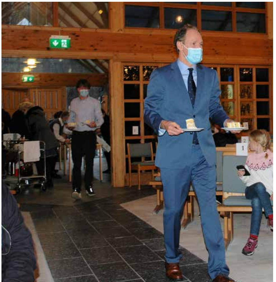
Etter gudstenesta var det kyrkjekaffi, men koronareglane gjorde at alle måtte sitja på plassane sine og venta på bli servert kaffi og kaker.