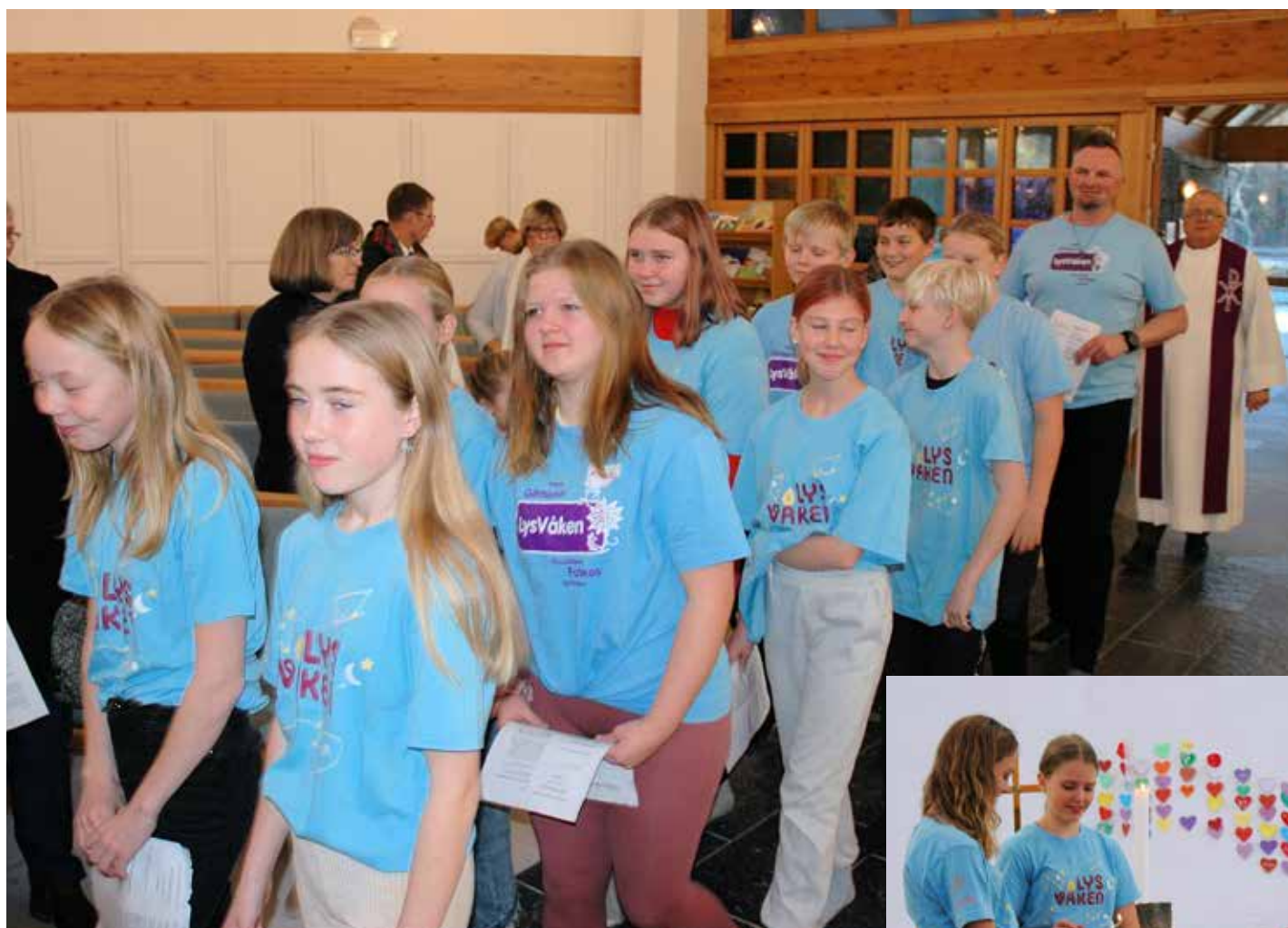
Over: Lys Vaken-deltakarane på veg inn til gudsteneste i Sund kyrkje. Til høgre: To av deltakarane tenner det første adventslyset. Under: Ein del av Lys Vaken var forsongarar i gudstenesta. Under t.h.: Ein frå Lys Vaken les ein bibeltekst.