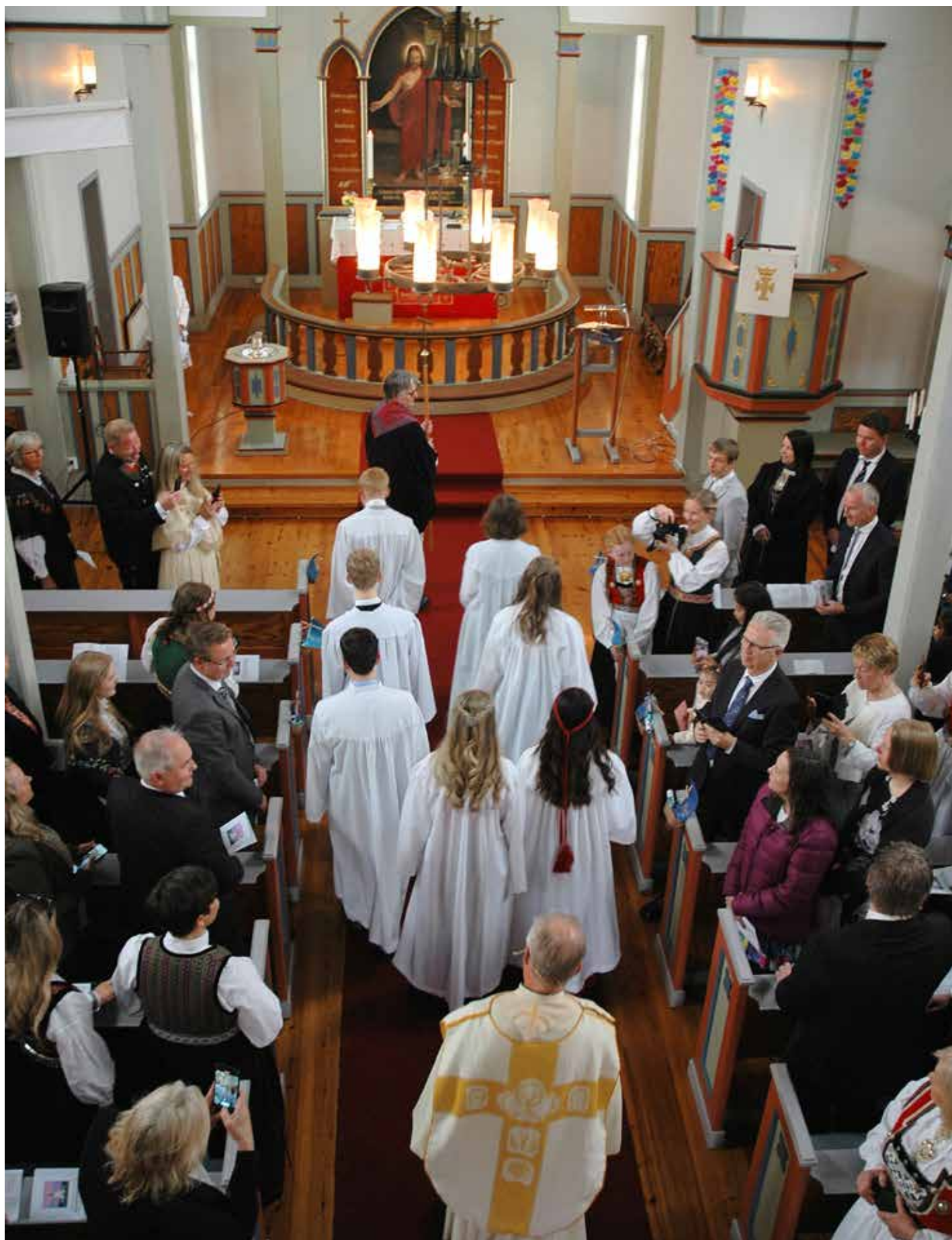
Prosesjon inn i kyrkja med dei sju konfirmantane.