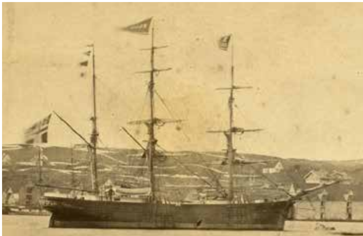
Misjonsskipet Elieser i Stavanger, truleg kort tid før første avreise.