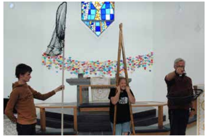
Presten hadde vore i naustet og henta litt fangstutstyr til andakten.