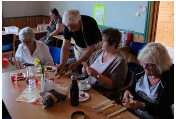
I to omgongar vart det selt årar ved borda.