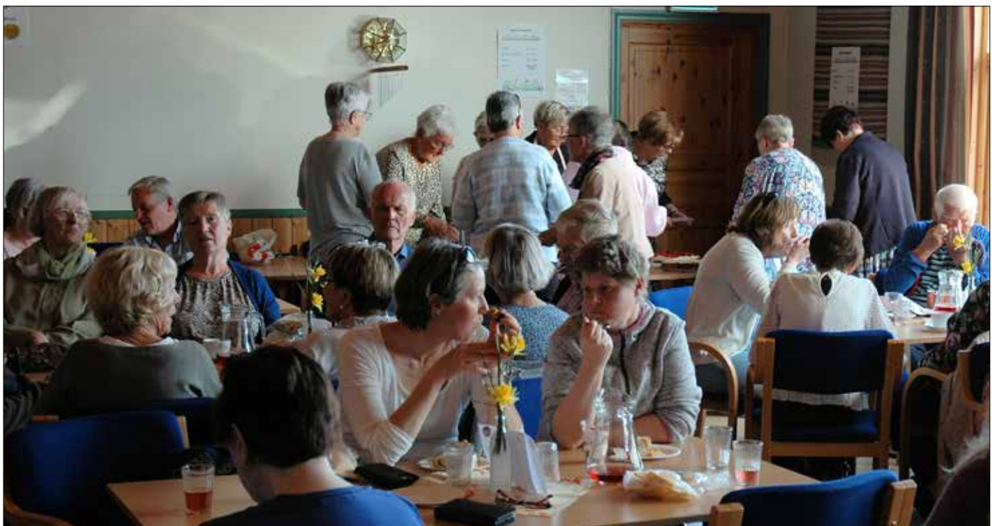
Mange var samla i Kausland kyrkjelydshus under Vårmarknaden. Ein jamn straum var innom kaféen i bakgrunnen.