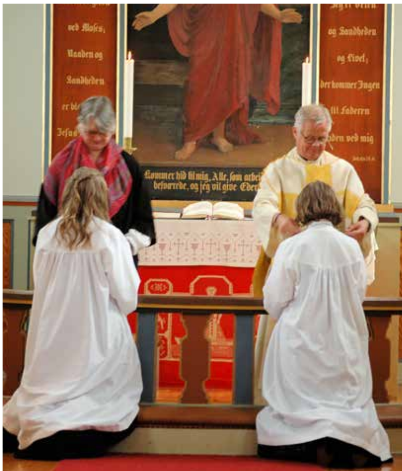
To av jentene kneler ved altaret og blir bedt for.