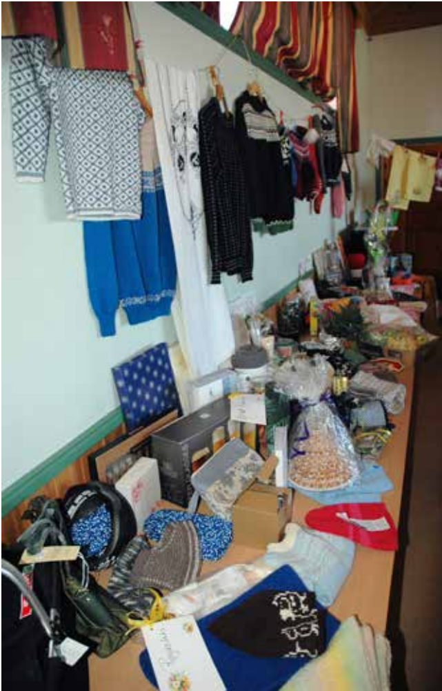
Mange fine gevinstar var hengde opp eller plasserte på bord langs den eine veggen.

Den tradisjonelle Vårmarknaden i Kausland kyrkjelydshus vart arrangert laurdag 22. april. Også i år var det mange som hadde møtt fram. Kafé var laga til også denne gongen, og her var det både graut og mange gode kaker å forsyne seg med. Og mange var det som besøkte kaféen i løpet av tilstellinga.