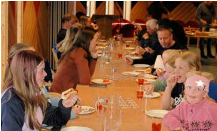
Middagen vart eten ved langborda.