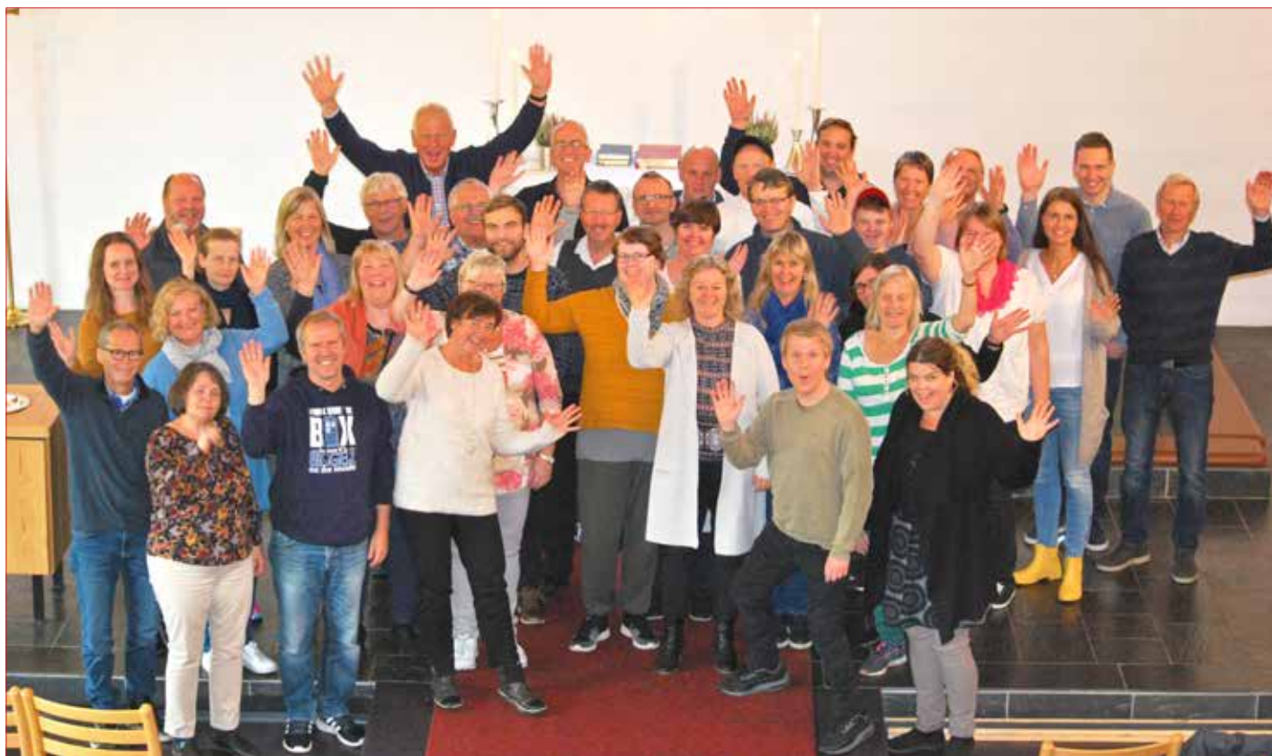
Kyrkestabane i Fjell, Sund og Øygarden på samling i Hjelme kyrkje 30. august.