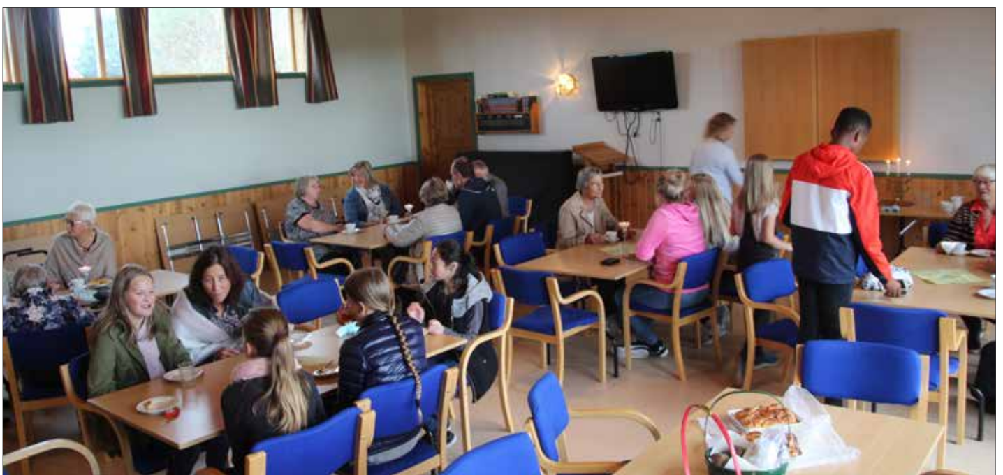
Etter gudstenesta var det også denne søndagen kyrkjekaffi i kyrkjelydshuset.