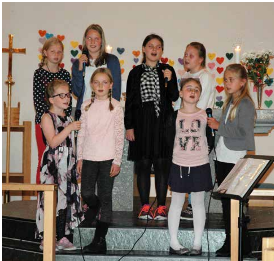
Fin song av Betweenskoret.