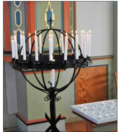
Lysgloben hadde ikkje plass til alle lysa, så ein måtte nytta telys i tillegg.