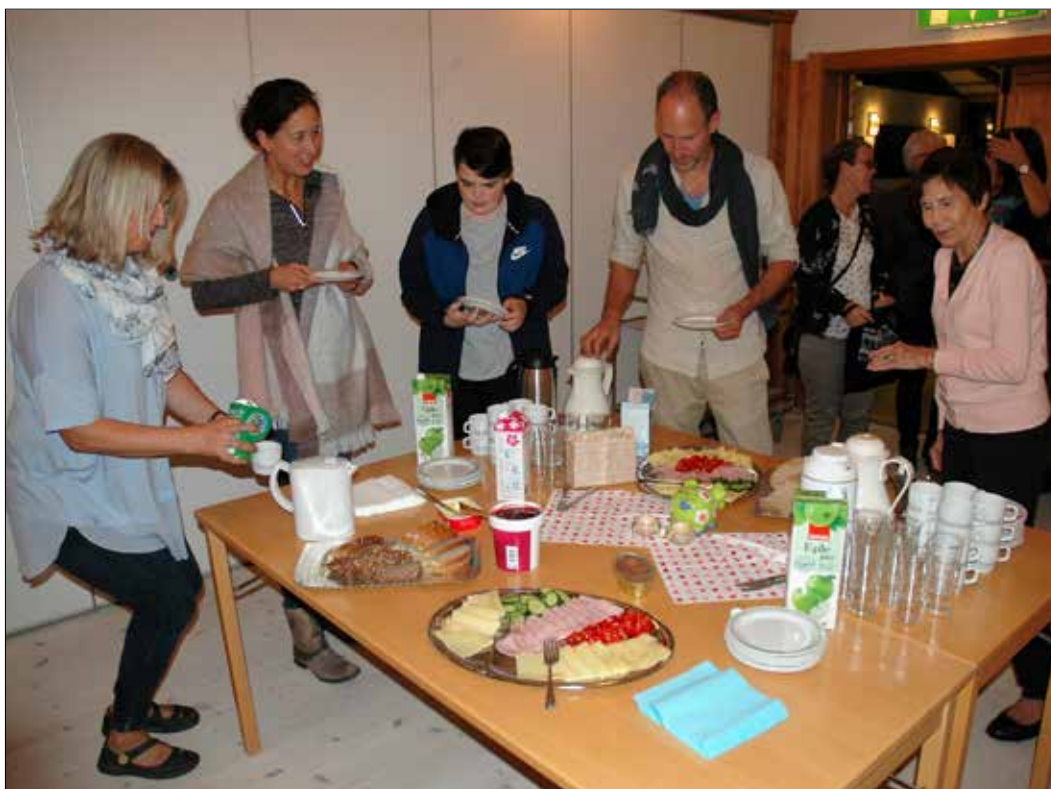
Etter lovsongskvelden kunne ein samlast i kyrkjelydssalen til eit felles kveldsmåltid.