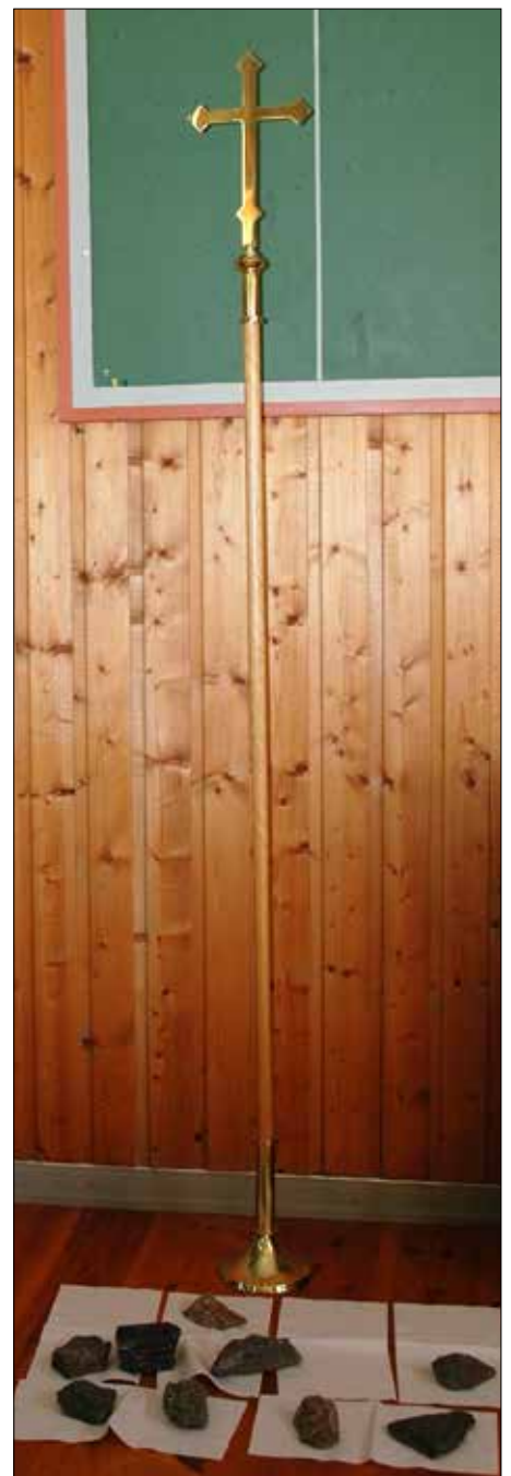
Ved krossen kunne ein leggja ned ein stein som symbol på ei bør ein ville leggja av seg.