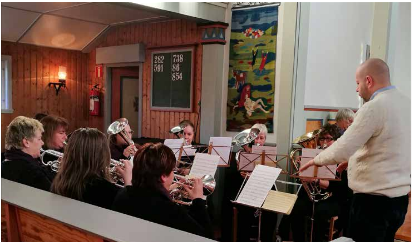
Under gudstenesta i Kausland kyrkje 19. november var det musikk ved Sund Brass.