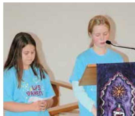
Bibelteksten blir lesen.