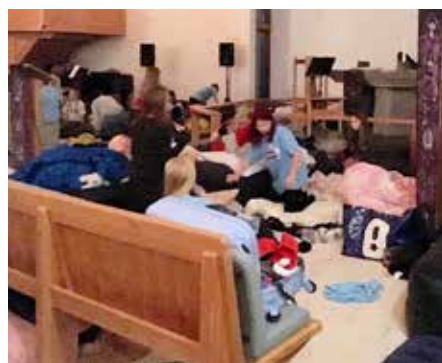
Her er det rigga til for overnatting.