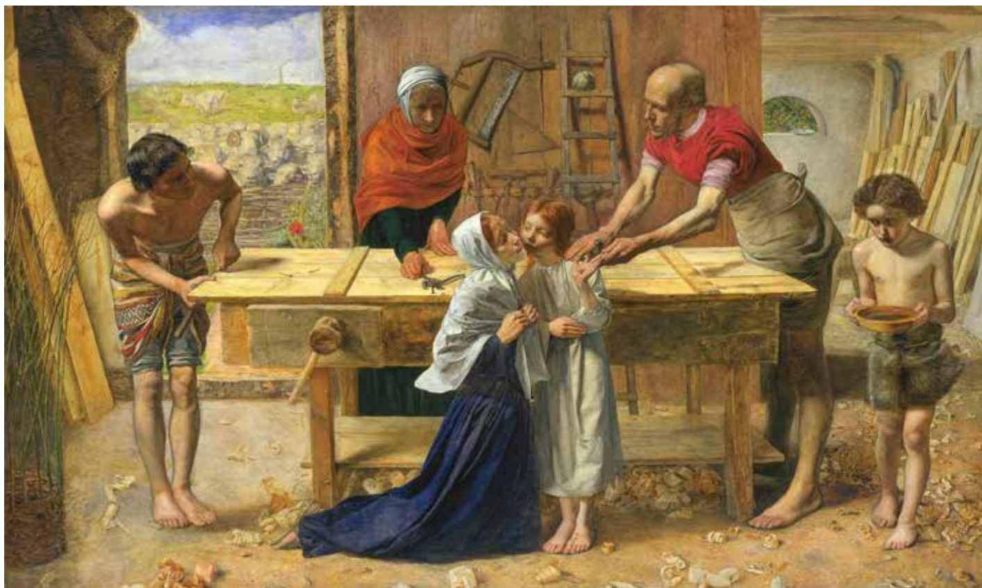
Christ in the House of His Parents ('The Carpenter's Shop') 1849-50; Sir John Everett Millais, Bt 1829-1896; Tate, Purchased with assistance from the Art Fund and various subscribers 1921