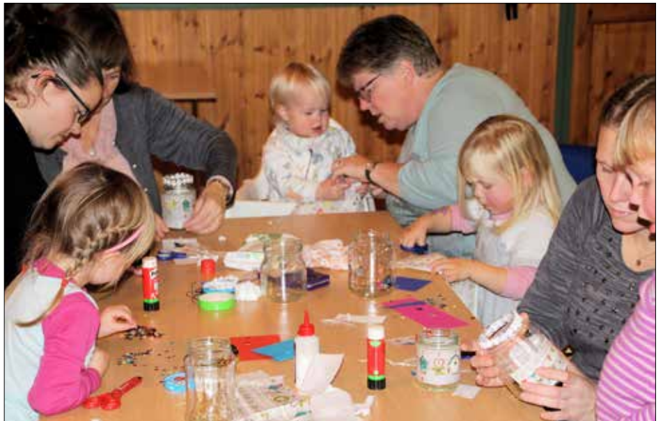
Her skal det lagast lyslykter.