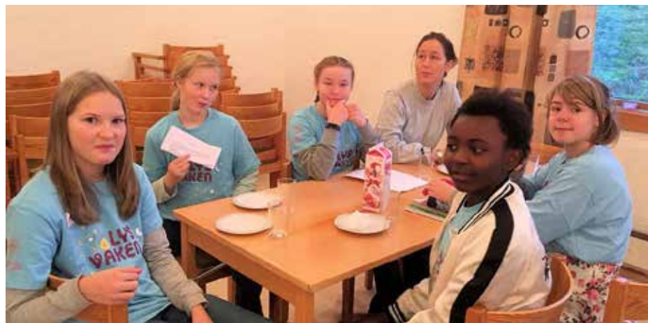
Mat må ein ha.