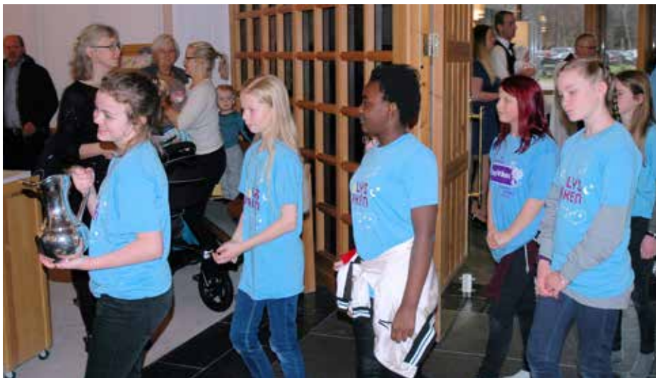
LysVaken-deltakarane på veg inn i kyrkja.

Alle dei trettisju 11-åringane samla framme i kyrkja saman med leiarane sine.