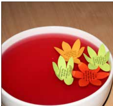
Kjærleiksrosene har sprunge ut.