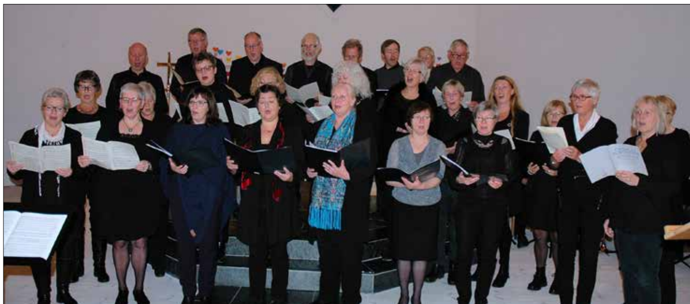
Alle kora samla til ei avslutning av konserten: Øygardskoret, Sotra Reviderte og Sangkompaniet.