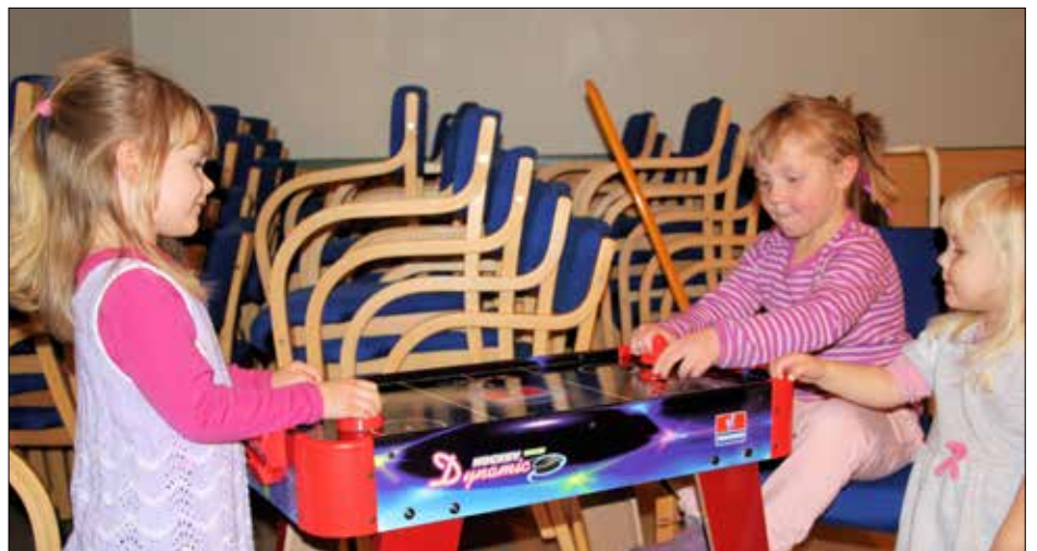
Det er kjekt å spela litt.