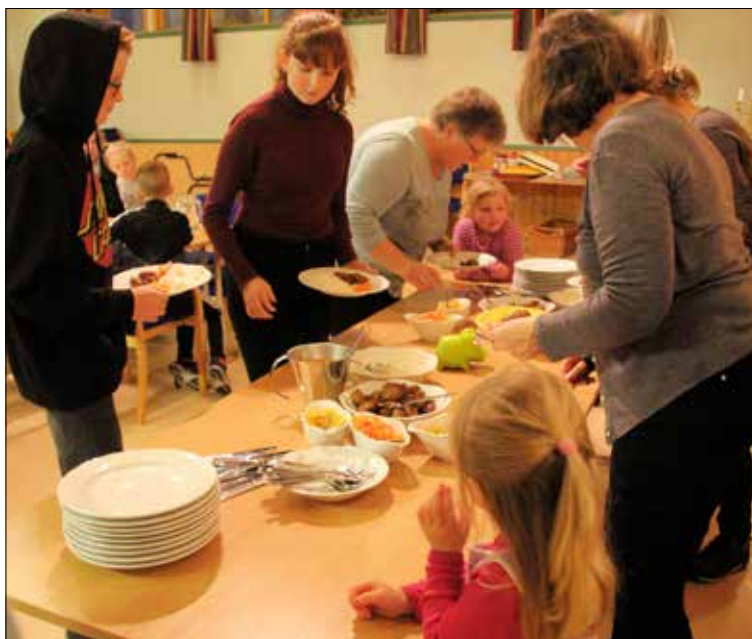
Maten er servert.