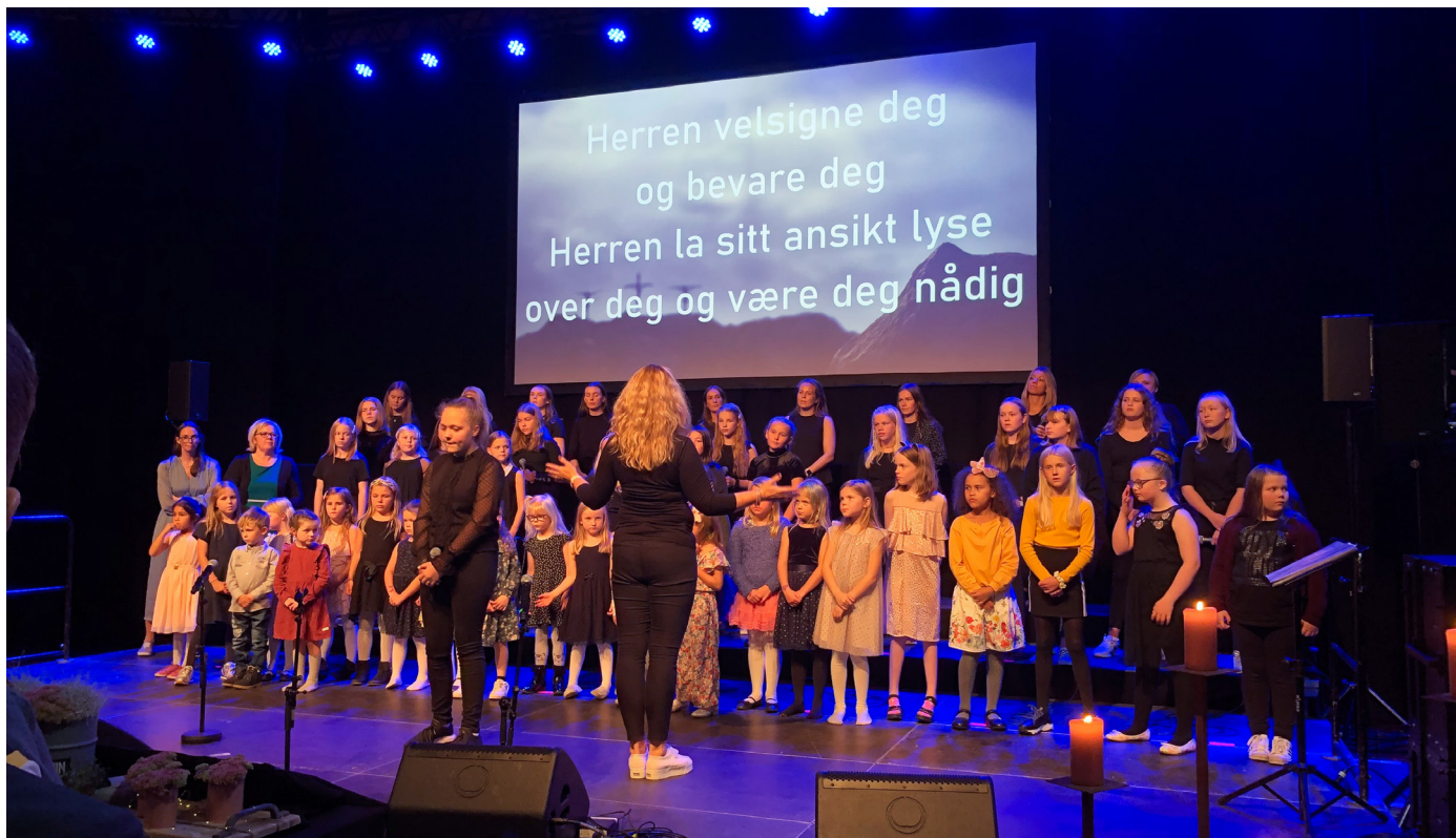
Gospel Teens og barnekoret Lyskastaren deltok på Øygardssong 20.–22. september.