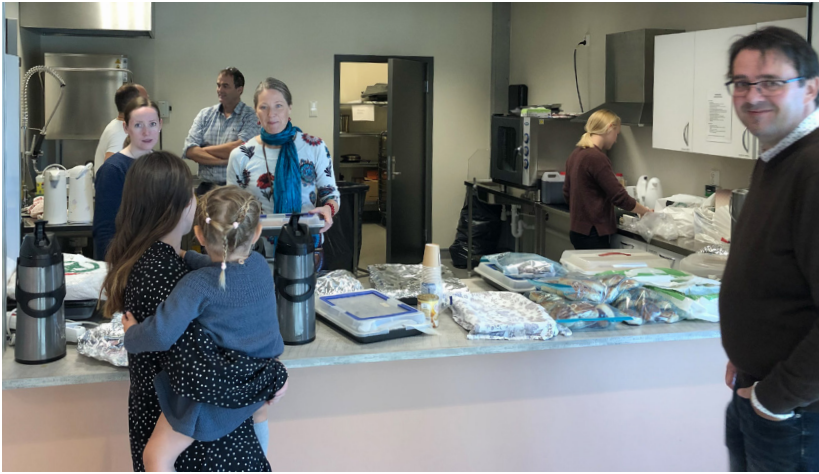
Mange frivillige stilte opp, her frå kafeen/kiosken.