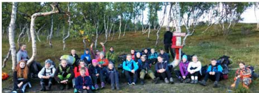
Dette året teller konfirmanterne 25 fra Innset, Berkåk og Rennebu sokn