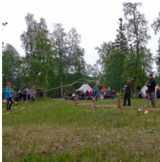
Lasso-konkurranse for store små hører med i midtsommerhelgen i Ankarede.