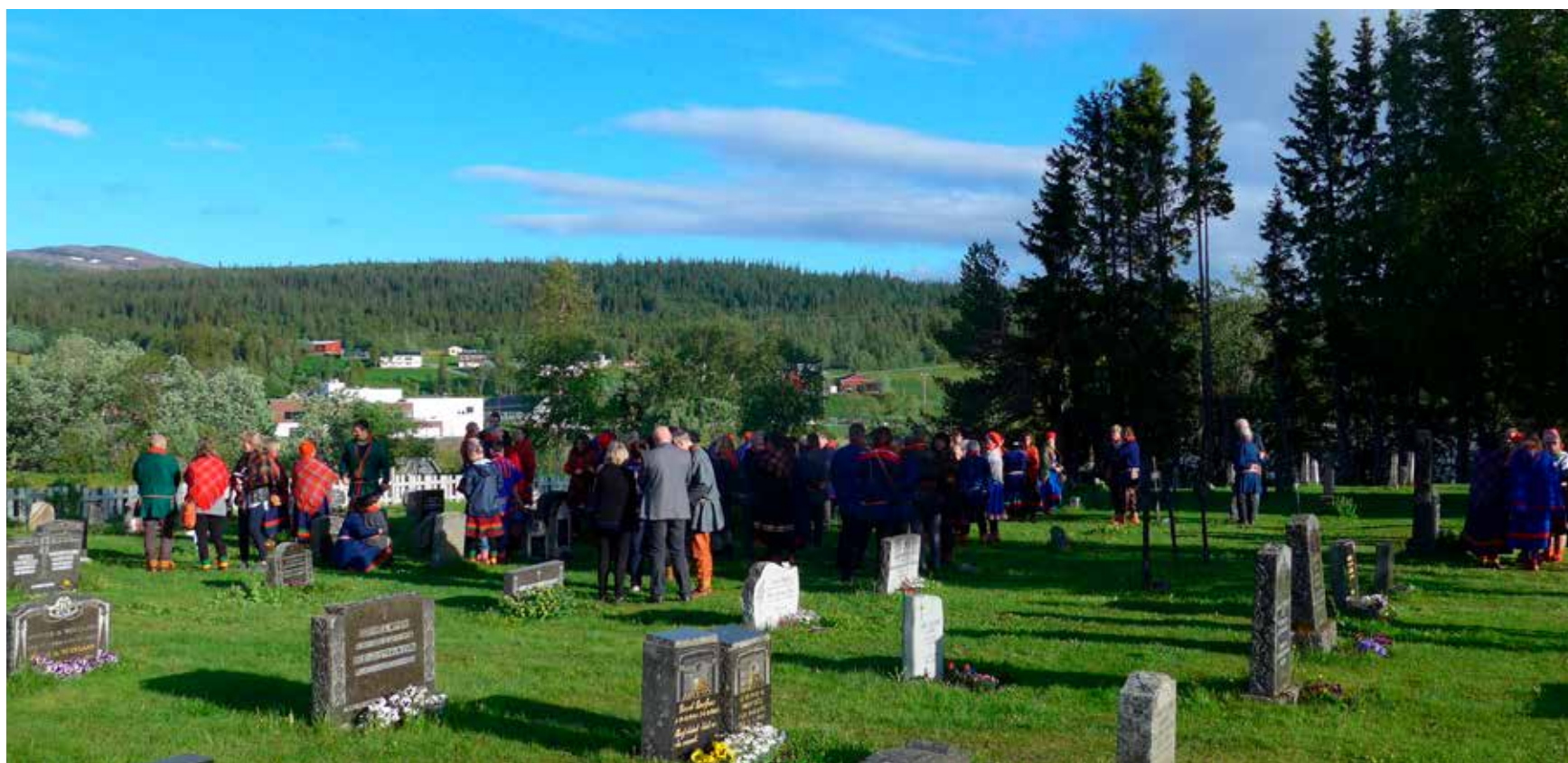
Det var stort oppmøte ved minnegudstjenesten i Røyrvik under midtsommerseminaret der.