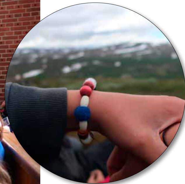
Den samiska frälsarkransen, gjord i naturmaterial av samiska slöjdare, blev en central del av konfirmandlägret.