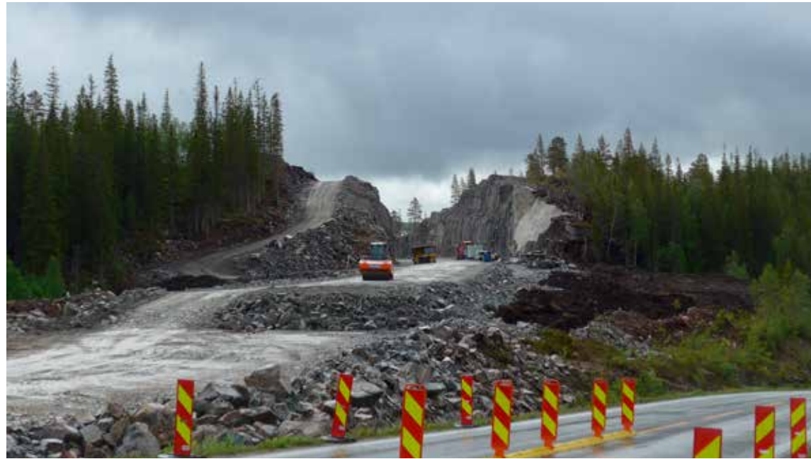
Her fra veiutbyggingen ved Sefrivatnet, like nord for Majavatn.

– Vi ønsker oss veien i tunnel eller bro over vegen for å få til en god krysning. Det er steder der jernbanen går i tunnel og vi skal reinen ledes med gjerder må den