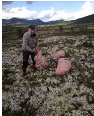
Moseplukking hører med for å sikre reinflokkene. Her høstes det i Follidal.

– Før var man mer i lag med dyrene, og da var de mer tamme. Det gjelder også i kalvmerkinga. Det er mange flere gjerder nå. Før ble merkinga ofte gjort på en tange eller på en snøbre. Men