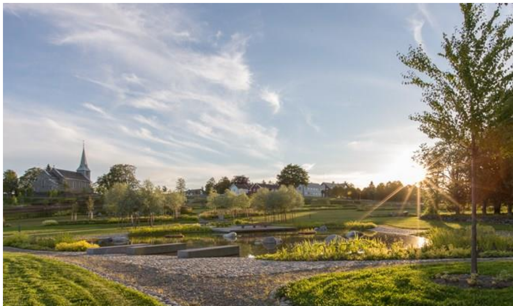
Havstein kirkegård.

Gravminne og gravutstyr må være i henhold til gjeldende vedtekter for Trondheim kommunes gravplasser.