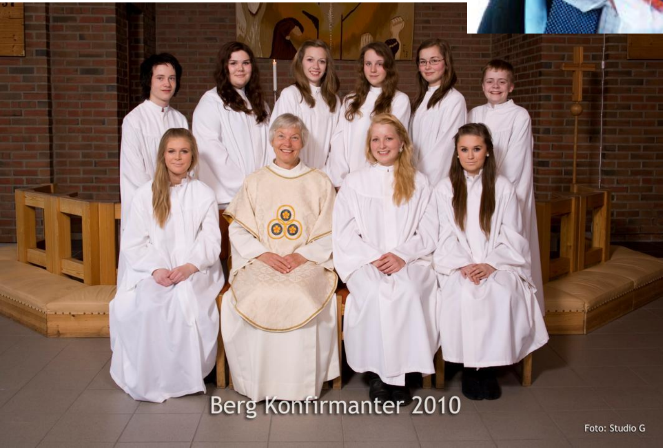
Berg Konfirmanter 2010