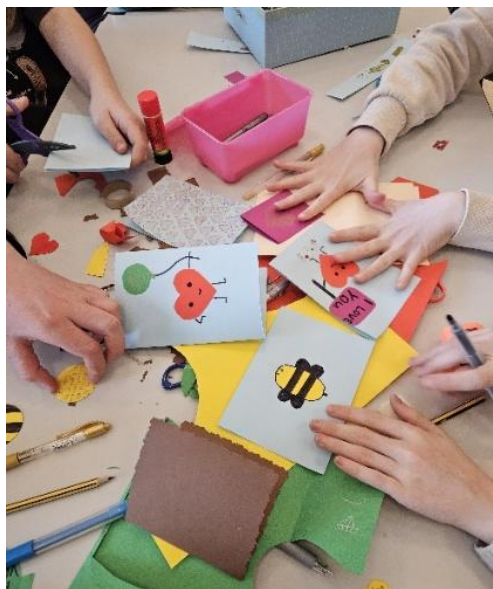
Aktivitet på IlaTweens

Noahs ark er et heldagstilbud Byåsen, Ilen og Sverresborg menigheter har på Sverresborg kirkesenteret en av skolens planleggingsdager i august. Tilbudet har tidligere vært forbeholdt 2.-klassingene, men fra 2025 har vi også besluttet å invitere 3.klassingene til arrangementet. Til tross for at årets Noahs ark-dag bar preg av regnvær, kom 21 barn og hadde en flott dag på kirkesenteret med fortellingen om Noah, båtbygging, mat og leker.