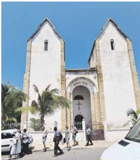
KATEDRALEN I TULEAR: Klokkene er i tårnet til venstre.