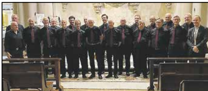
Dale mannskor, saman med presten, i kyrkja La Sagrada Familia i Barcelona i fjor haust.