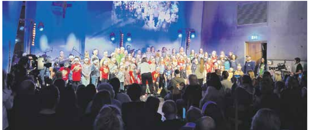
STAMNES BARNEKOR: For eit stort barnekor!

Stamnes barnekor avslutta sesongen sin for denne gong med å syngja på basar i Stamnes bedehus 20. februar. Før det hadde me hatt øvingar kvar torsdag, og sunge på fleire tilstelningar, både på gudstenester og andre ting. Nokre av kormedlemene reiste i januar på Barnekorfestival i Ytrebygda kyrkje i Fana. Det var ei stor oppleving å syngja i kor saman med