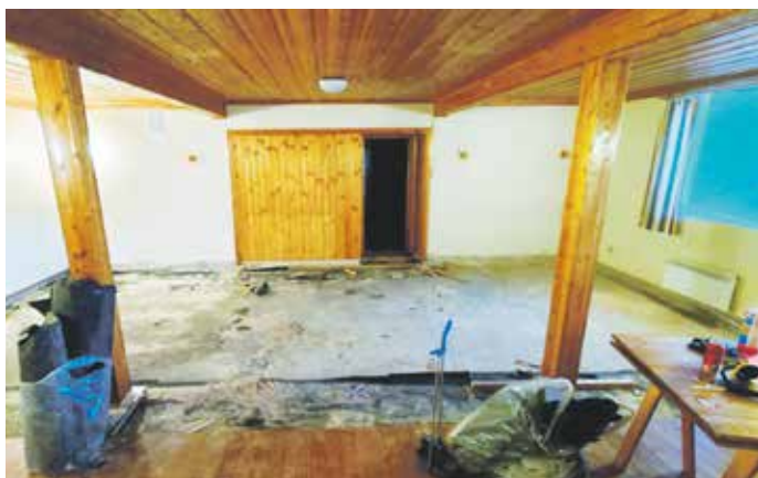
SKADE: Golvet i kyrkjekjellaren måtte rivast opp.

Seint om kvelden søndag 15. desember vart det oppdaga at det hadde trengt vatn inn i Bergsdalen kyrkje.