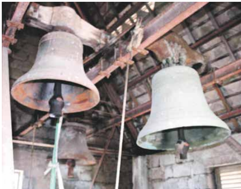
KLOKKENE: Bilete viser tre klokker. Kven av desse som kom frå Dale, kunne ingen svara på. Men ein av dei er det.