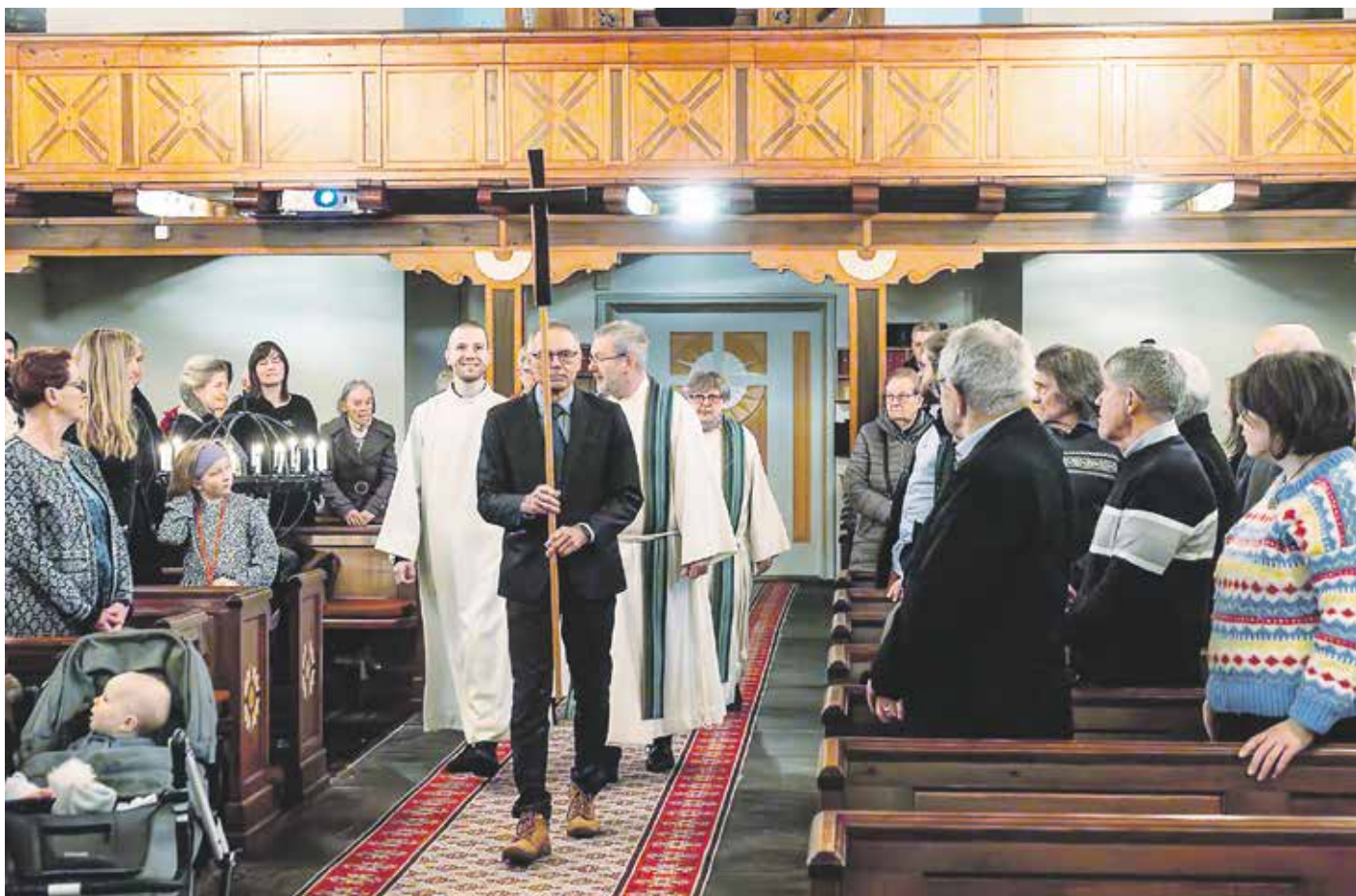
AVSKILSGUDSTENESTE: Prosesjon på veg inn i kyrkja.