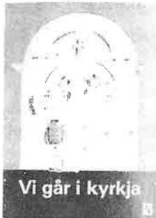
Vi går i kyrkja

I mange år har kyrkjelydane sendt dåps-helsing på dåpsdagen, og delt ut "Mi kyrkjebok til fireåringar. No er me komne eit steg vidare i "Undervisningsprogram for heim og kyrkje". I år får sju-åringane utdelt "Vi går i kyrkja" ved ei familiegudstenesta. Boka skal gje hjelp til å vera med i gudstenesta, og har og ei rettleiing for foreldre. Dei fleste skulane har sagt frå at dei vil nytta boka i førsteklasseane.