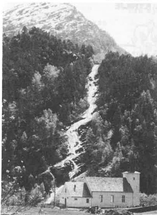
"HER HEV LIVSENS KJELDA RUNNE" -BEDEHUSKAPELLET PÅ EIDSLAND-

HØYR KOR KYRKJEKLOKKA LOKKAR MED EIN HØG OG HEILAG KLANG ALLE FOLK OG ALLE FLOKKAR TIL EIN HUGSAM KYRKJEGANG! SYSKIN, LAT OSS KALLET FYLGJA YVE BERG OG YVE BYLGJA. LAT OSS GÅ PÅ KYRKJEVEG GLADE BÅDE DU OG EG!