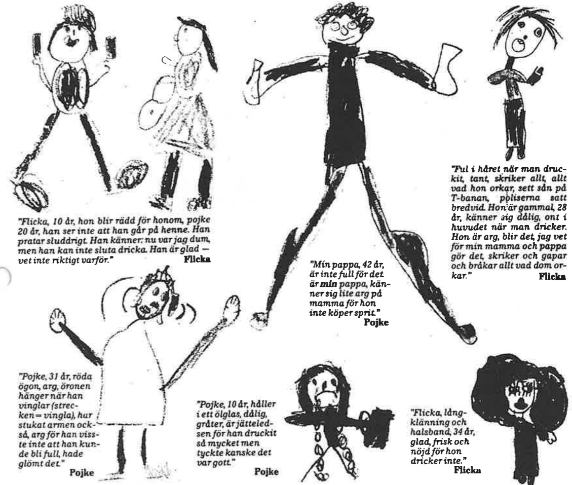
Illustrationerna hämtade ur boken "Barn och alkohol"

Forfatterne mener det er forskjeller mellom samfunnene –