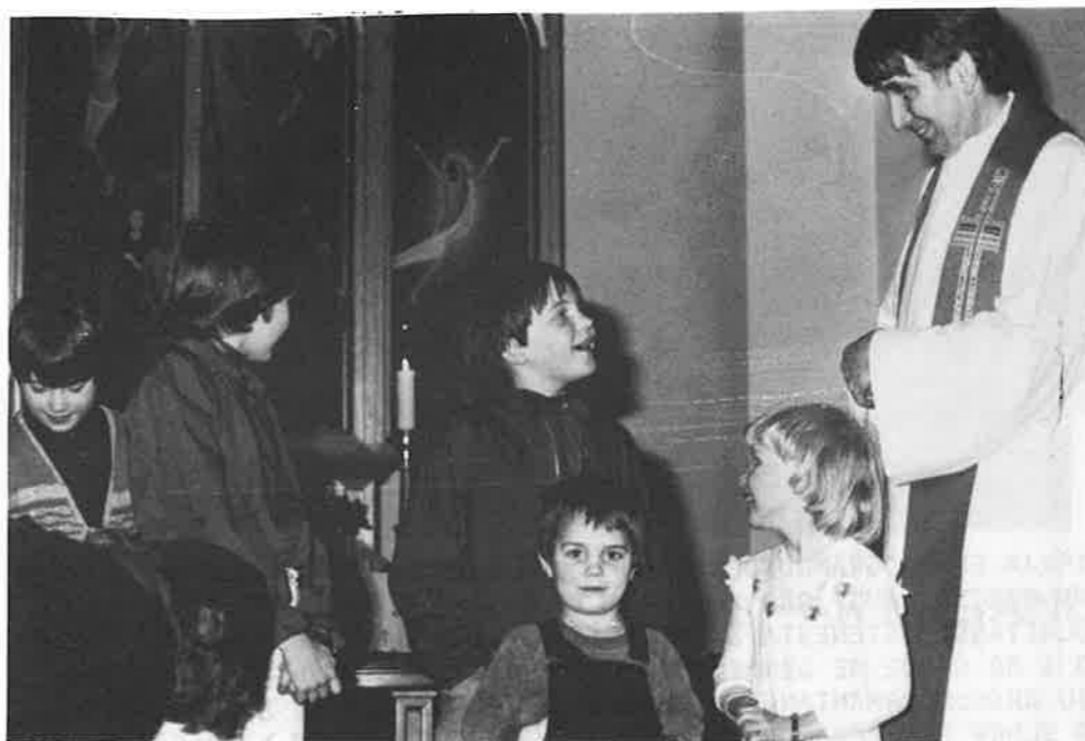
Magne brukte nokre av borna til å gjera levande likninga om arbeidare i vingarden. Og sjølv fekk han ein treskulptur av ein sāmman til

TASTA PRESTEGJELD er den delen av Stavanger som ligg mot nord. Det er ein del fleire innbuarar enn i Vaksdal, ca. 7500, men berre ei kyrkje. Det er ei ny arbeidskyrkje med gode arbeidstilhøve. Kyrkja er lett å sjå når ein kjem med ferja over Mekjarvik frå Skudenes. Prestebustaden er det noko verre å finne. Den ligg i rekkehus i Dusavikvegen. Sjølv om storleiken ikkje kan samanliknast med prestebustaden på Dale, så er det god plass for alle som vil koma på