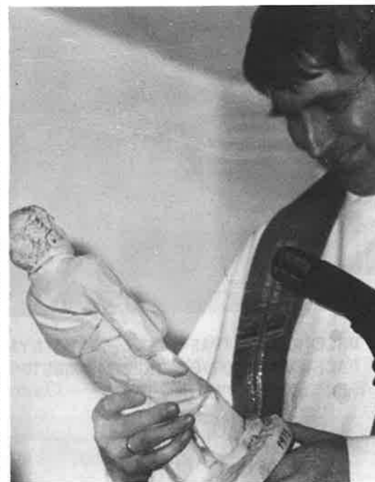
takk for sāmmannsarbeidet i Vaksdal