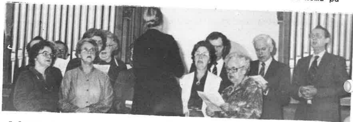
Frå Vaksdal kyrkja. Kyrkjekoret var på plass på galleriet, og Fides song frå koret, med litt forsterking frå Dale Ten Sing.

Litt dramatisk fekk me og med oss før me for. I eksingedalen gjorde snø og vind at me kom for seint både til avskilsgudstenesta på Nesheim og i Vaksdal om kvelden. Det var første gong på dei ti åra i Vaksdal eg har måtta gå ut av bilen for å vera sikker på kvar vegen gjekk! På vegen nedatt var det berre å gje opp og vente på brøytebil. Det var ei hending mellom mange som fortel at tenesta i Vaksdal kan vera både spanande og krevjande.