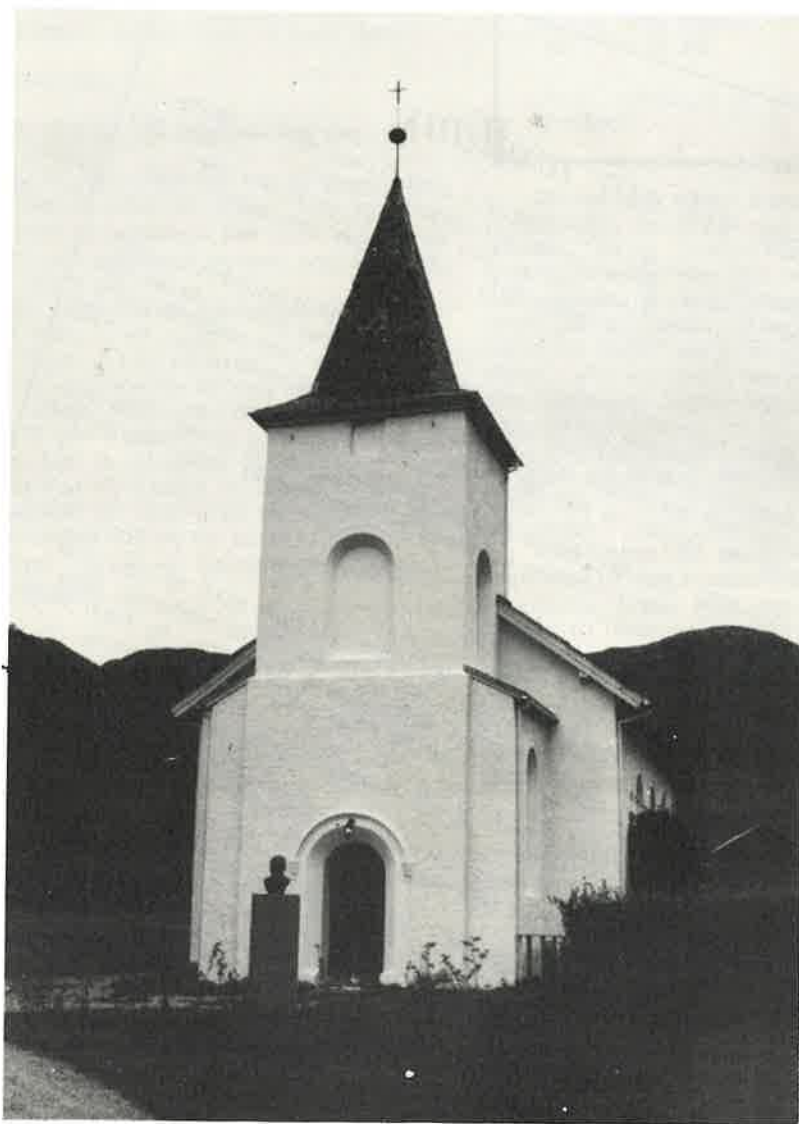
KYRKJA PÅ FLATEKVAL