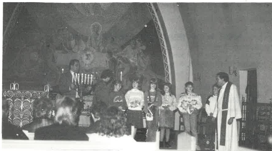
UTDELING AV GODT NYTT TIL 4. OG 5. KLASSINGANE PÅ STANGHELLE SKULE 15. JANUAR 1989. STRAUMEN GJEKK SÅ DEN SJUARMA LYSESTAKEN MÅTTE FRAM.

...at me må læra å telja våre dagar, så me kan få visdom i hjarta.