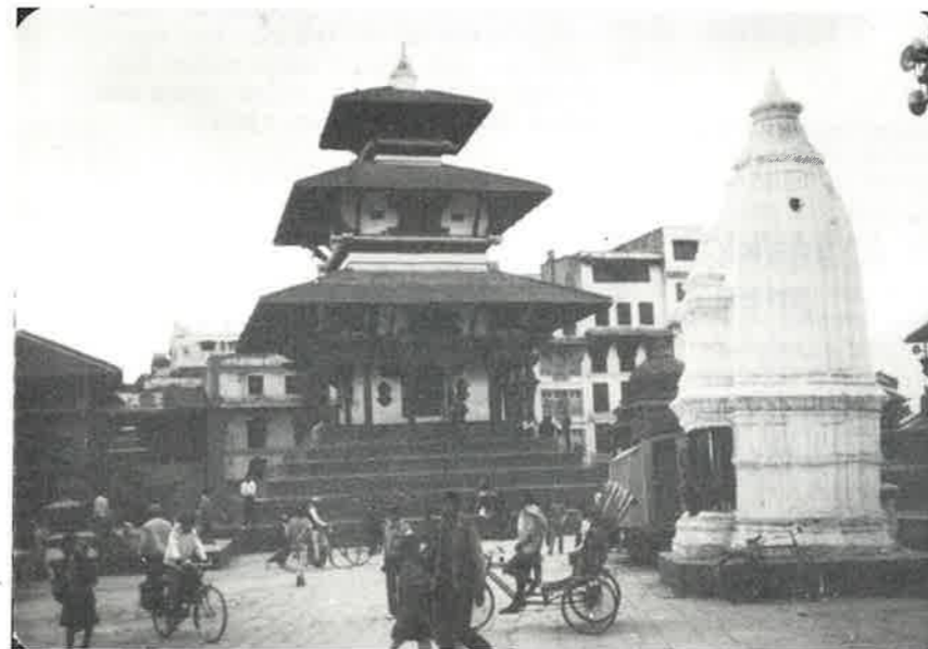
Frå Kathmandu. Slike hinduistiske tempel finn ein på mest kvart gatehjørne.