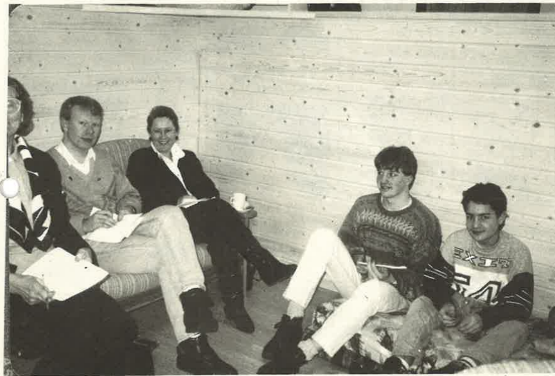
Her er ei av gruppene i sving under seminaret.

Etter innleiingsforedraget var det gruppearbeid der ymse tiltak for å få i gang arbeid for ungdom vart diskuterte. Deltakarane var i alle åldrar og frå ymse stader i Vaksdal Kommune. Det var også folk frå Modalen med. Under gruppearbeidet kom det fram mange tiltak, fortel ein av initiativtakarane, Åshild Rene. Ho fortel at det resulterte i fem konkrete tiltak.