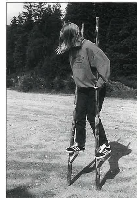
Her er det visst ei som kan kunsten å meis- tra styltene.