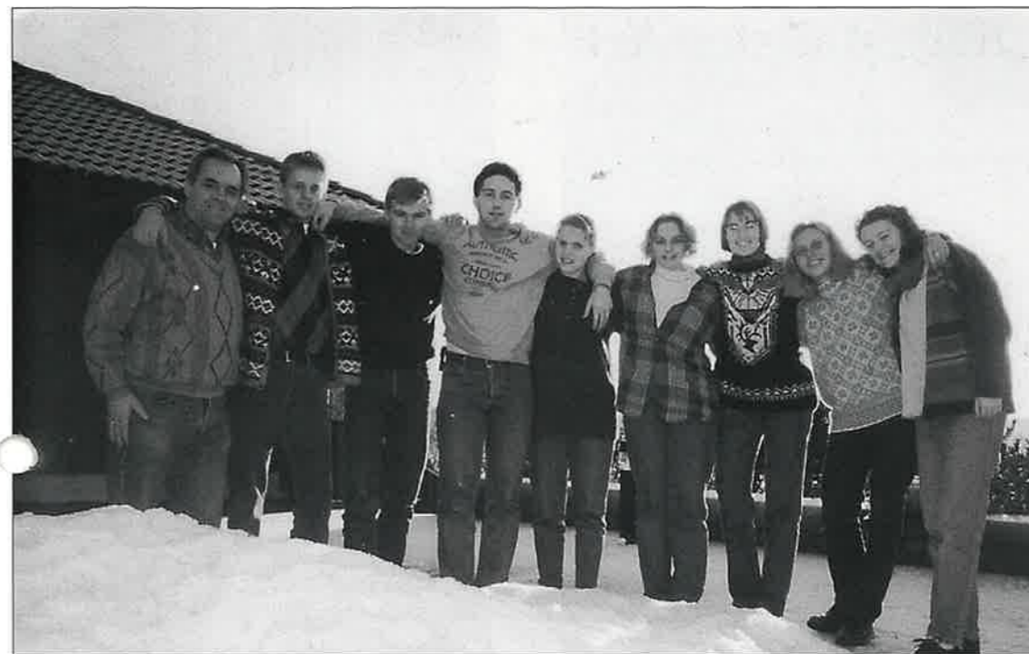
Her er alle som byrja etter nyttår samla. Me gjekk alle på lina Bibel og teneste.