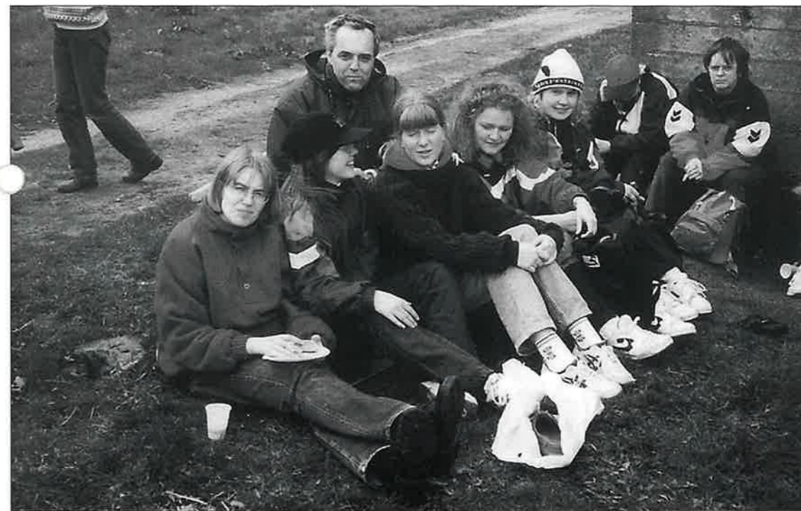
Dette er frå turen me hadde til Herdla på Askøy