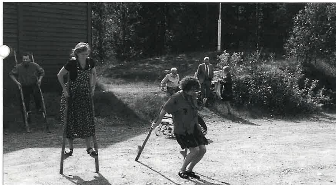
Nei styltegang er ikkje det enklaste å driva med. Her er det søster til soknepresten som må i bakken.