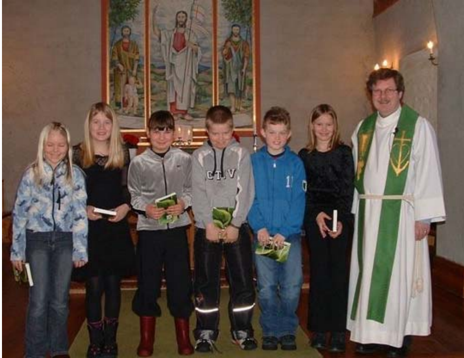
Bergsdalen kyrkje 23.januar 2005

I Bergsdalen kyrkje 23.jan. og Eksingedalen kyrkje 2.jan. var det 100 % frammøte.