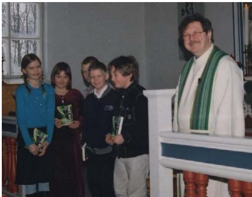
Eksingedalen kyrkje 2.januar 2005