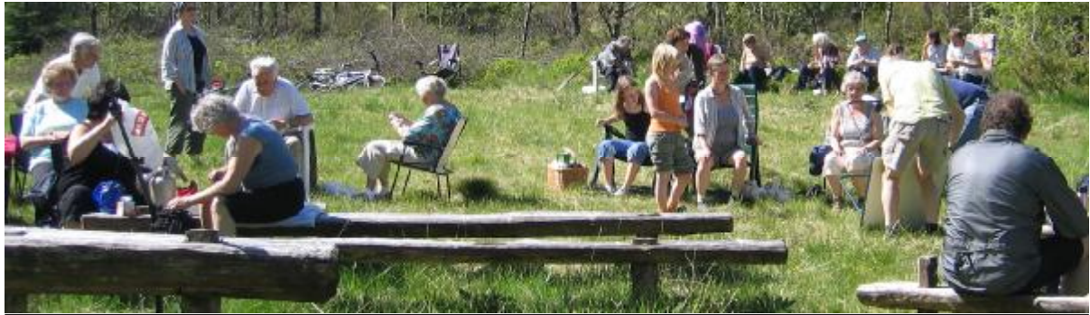
Frå årets Vassbakkstemna ved Vikavatnet i Stamnes 3.juni