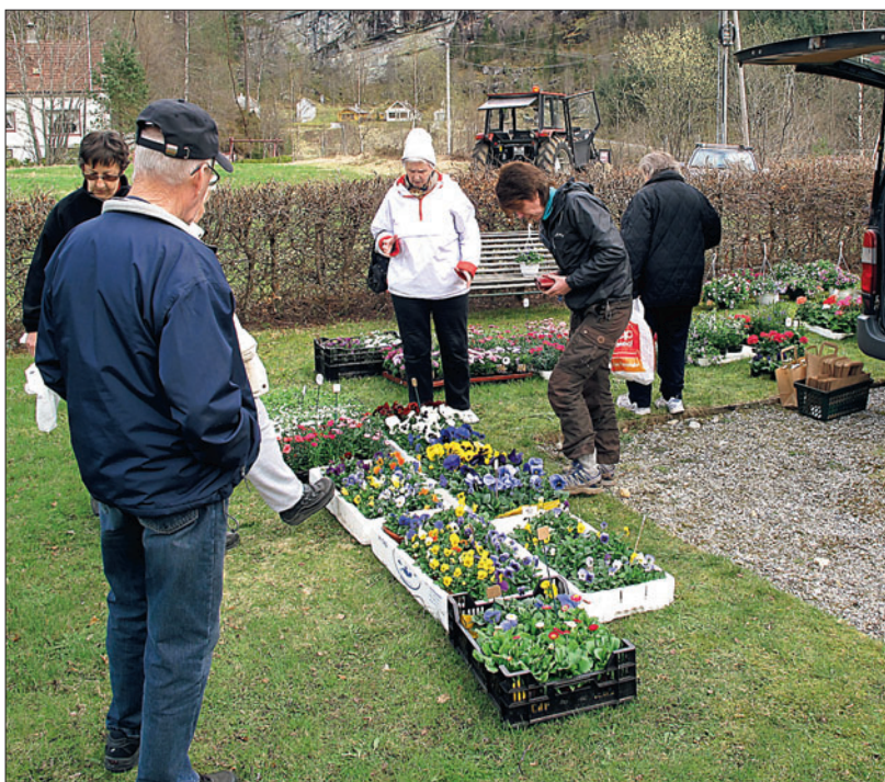
Eidsland. Astrids Gartneri leverte som vanleg eit godt utval plantar.

Det har vore kyrkjegardsdagar på Eidsland, Stamnes, Bergsdalen, Nesheim og Flatekval. Planting på kyrkjegardane, nokre stader kombinert med dugnad, har no vorte ein fast årleg tradisjon.