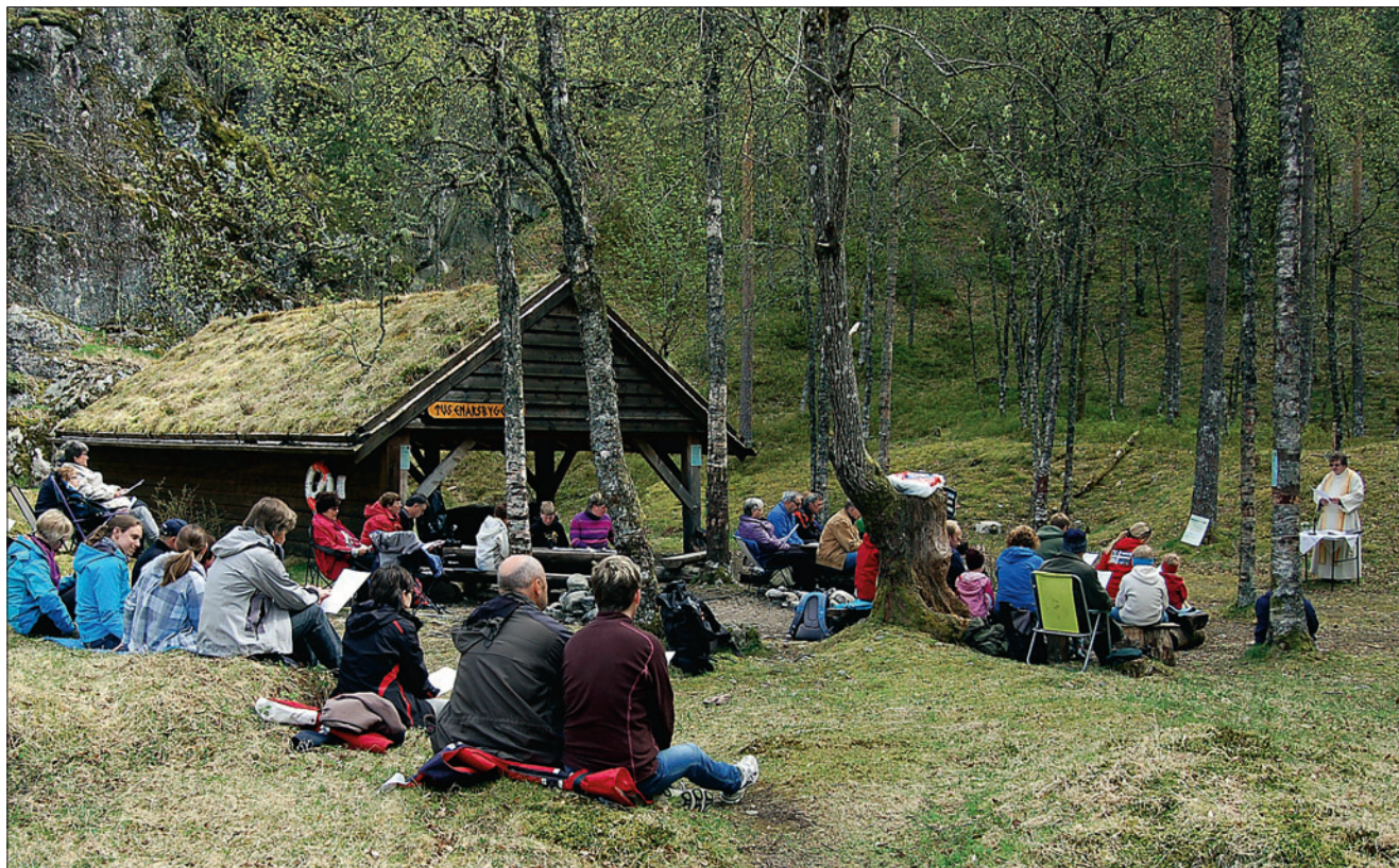
Sokneprest Edvard Bø held gudsteneste.