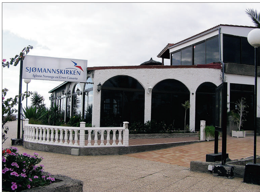
Verdas best vitja sjømannskyrkje finn du på Gran Canaria.

Forutan å vere vid kjent for vaflene sine, tilbyr og kyrkjene i Hamburg, New Orleáns, Dubai og Costa Del Sol eit overnattingstilbod. Sjømannskyrkja har eksistert siden 1864 og me har heile tida freista å vere ein heim langt heimaifrå, men dette med overnatting er eit relativt nytt tilbod hjå oss. I kyrkjene me no tilbyd