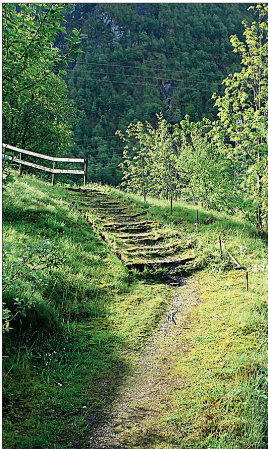
Vegen mellom dei to gravplassane på Dale vert rusta opp. Me fjernar dei to nedste trappene, og grusar opp. Nytt rekkverk skal på plass.