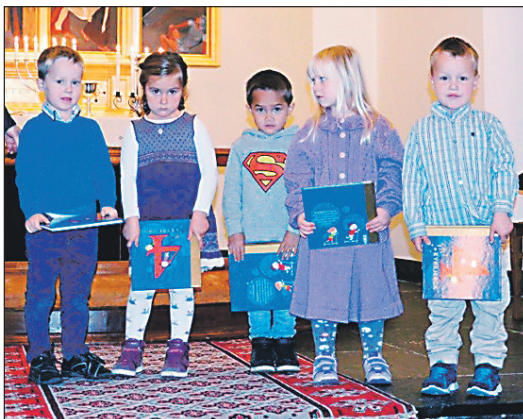
Fireåringar på Vaksdal med fireårsbok!

Fagertun, som det står om litt seinare i bladet.