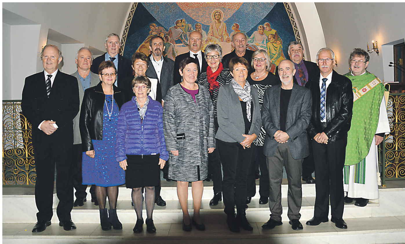
50-årskonfirmantar på Dale 11. oktober.