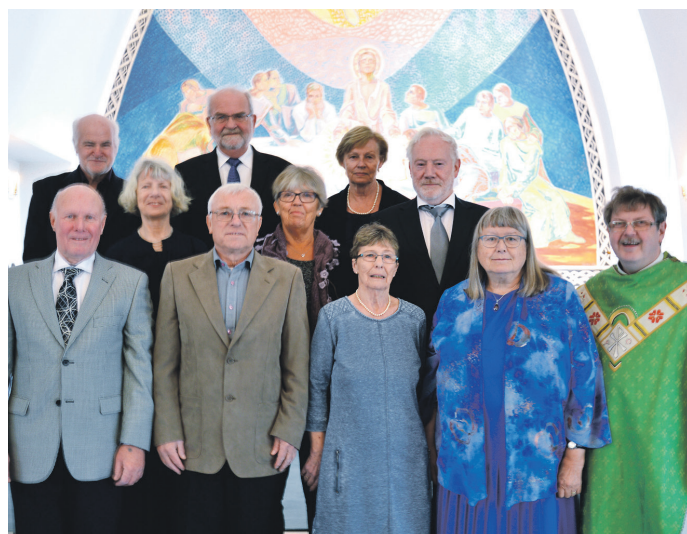
50-årskonfirmantar på Dale 11. oktober,