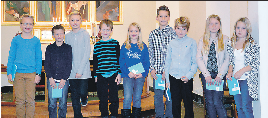
Ein fin gjeng tiåringar på Vaksdal.