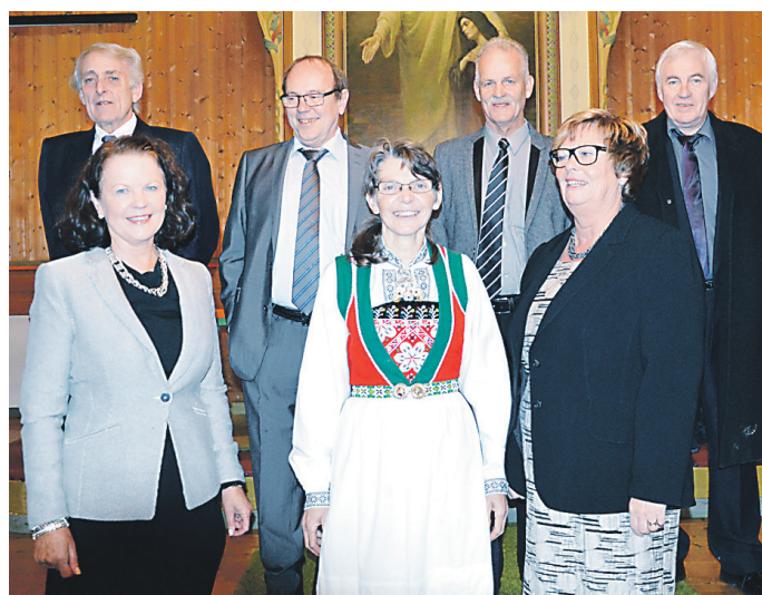
50-årskonfirmantar på Stamnes 31. oktober,