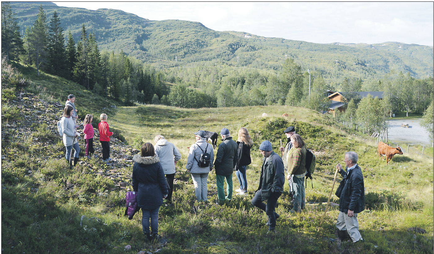
Pilgrimsvandring for niåringar i Bergsdalen.