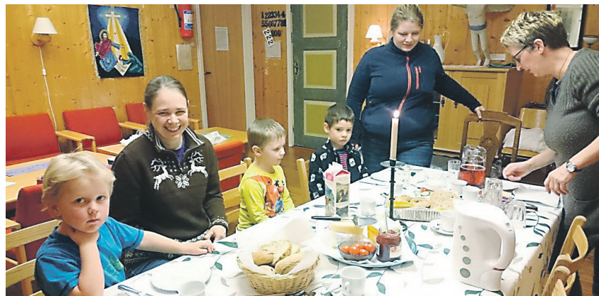
Fireåringar samla til kveldsmat.