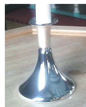
Lysestake til dåpslys.

Så har kyrkja på Stamnes også lenge hatt trong for å skifta ut den gamle løparen i midtgangen i kyrkjekipet, og dette er no endeleg gjort. Den nye er i blåtonar, og er slik soknerådet ser det, med på å forsterka det lyse og venlege i interiøret i kyrkja. - Dessutan ligg det