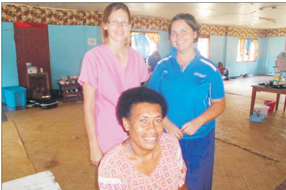
Klinikk i samfunnshuset i ein landsby.