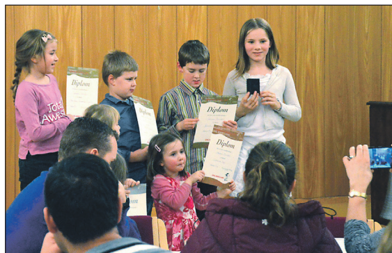
Mange born hadde vore så lenge med i barnekor at dei fekk diplom.

korset ved prosesjon, tekstlesing, dramatisering og framsyning av egne teikningar. Ei kjekk helg, både for agentar og heldige vaksne som fekk vera med dei!