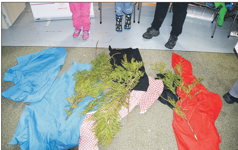
På Palmesundag gjer ein vegen fin når Jesus rir inn i Jerusalem

Palmesundag er årets elleveåringar i Eksingedalen spesielt inviterte til gudstenesta i Eksingedalen kyrkje kl. 11. Då skal dei få utdelt Nytestamentet, og det vert kyrkjecaffi etterpå.