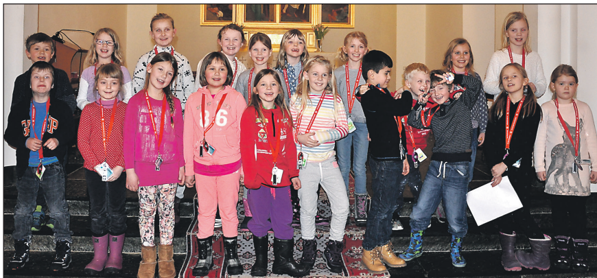
Tårnagentane 2016! Ein fin gjeng.

6. og 7. februar var det tårnagenthelg på Vaksdal! Årets åtteåringar var inviterte, og 21 spente tårnagentar kom og vart med på opplegget, der dei mellom anna fekk eige agentbevis, utforska kyrkja og