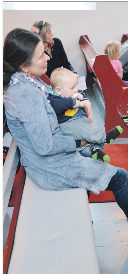
Natalia kan brukast til mykje.