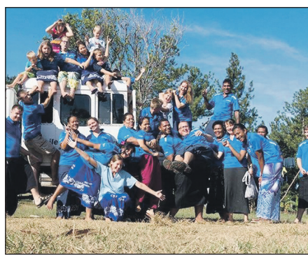
Medical outreach team.