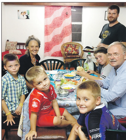
Heime i huset vårt - besøk av mormor og besten.