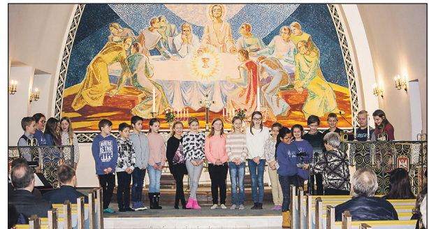
Ein fin gjeng frå Dale sokn fekk Nytestamentet.