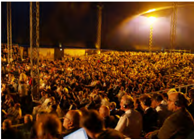
Plenumssamlingene under EEA3 i Sibiu, Romania finner sted i et gigantisk møtetelt sentralt i byen.