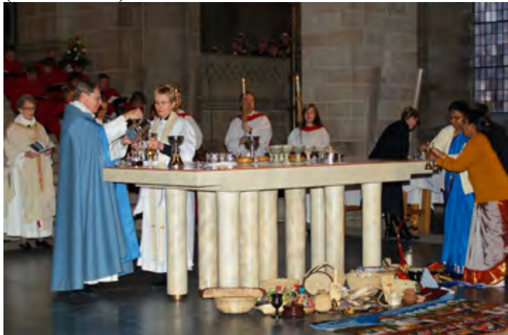
Fra festgudstjenesten i Lund. Foran alteret ligger gaver til LVF fra medlemskirker over hele verden.

Domkirken i Lund var fullpakket da Det lutherske verdensforbund markerte at det i år er 60 siden det verdensvide fellesskapet av lutherske kirker så dagens lys. Menigheten bestod av et fargerikt fellesskap av kirkeledere fra alle verdensdeler.