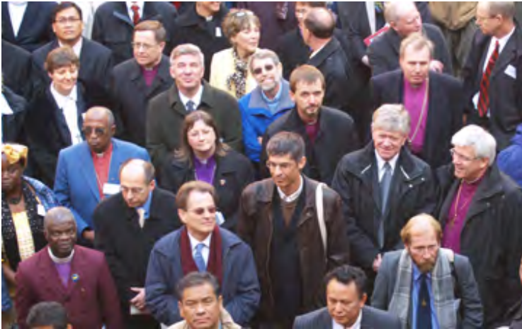
De lilla biskopsskjortene hører til i et fellesskap med både lekfolk og prester.

Tilsynstjenesten er en tjeneste med ord og sakrament. Derfor er den aldri bare en rent administrativ eller institusjonell oppgave, men utøves alltid som en personlig tjeneste. I oppgaven med å videreføre den apostoliske tro befinner denne tjenesten seg innenfor fellesskapet, samtidig som den er henvendt til fellesskapet.