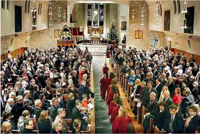
Bildetekst: I Bodø domkirke var det tre gudstjenester julaften.