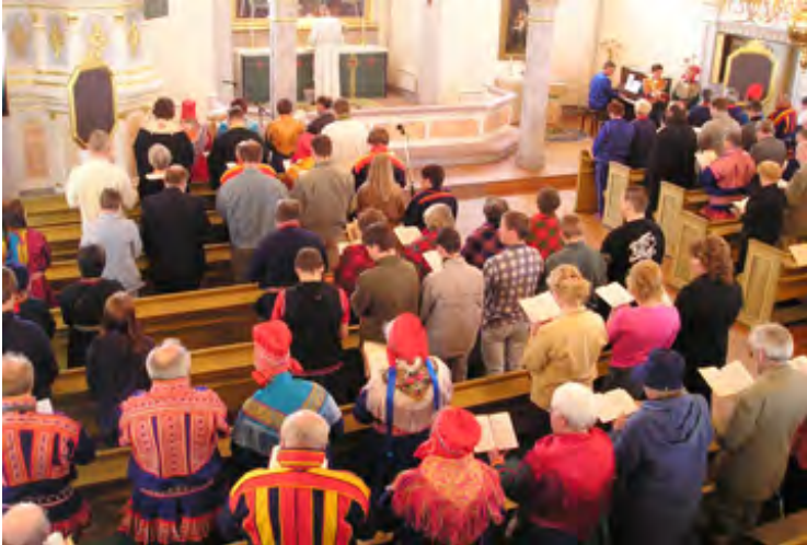
Illustrasjonfoto: Samisk gudstjeneste

Les denne pressemeldingen på lulesamisk Les denne pressemeldingen på nordsamisk