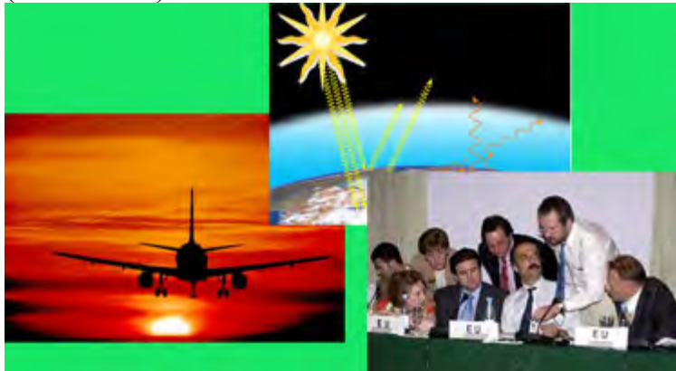
Ill.: Environmental Science Published for Everybody Round the Earth

Dette skriver Mellomkirkelig råd for Den norske kirke i en uttalelse i anledning av at FNs klimapanel har utgitt sin rapport.