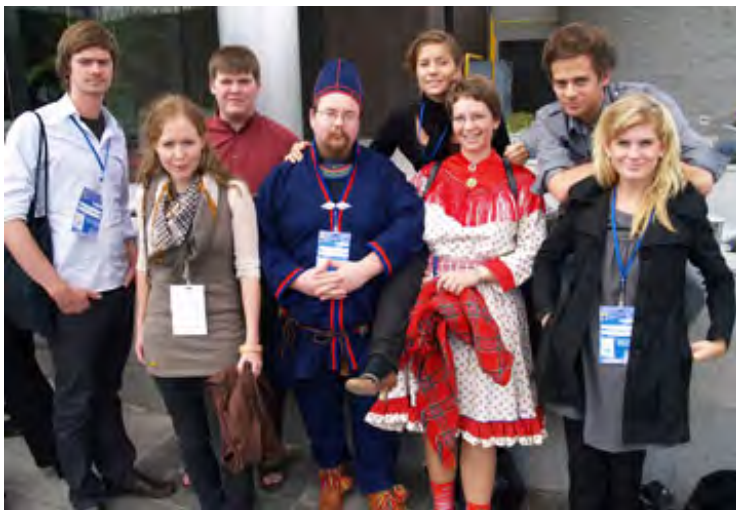
Den unge delen av den norske delegasjonen til det europeiske økumeniske stormøtet i Sibiu, Romania, 4.-9. september 2007.