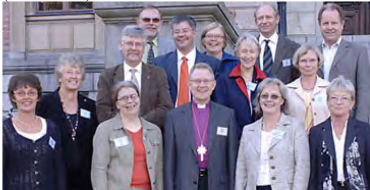
Svenska Kyrkans Kyrkostyrelse besøker Den norske kirke denne uken.

Onsdag og torsdag er det møter i Kirkerådets sekretariat i Kirkens hus i Oslo og fredag er den svenske delegasjonen i Margaretaforsamlingen i Oslo.