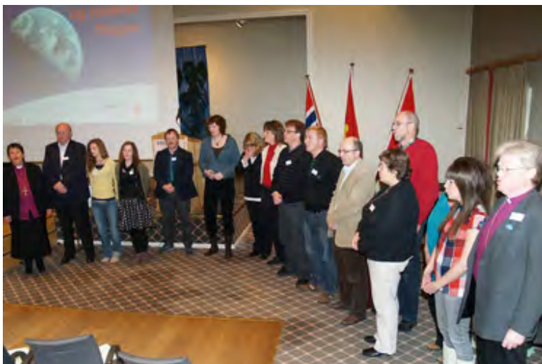
Den kirkemøtekomiteen som forberedte miljø-saken til behandling i Kirkemøtets plenum, ledet forsamlingen i salmen "Deilig i jorden" i forkant av avstemningen.

Kirkens øverste representative organ uttaler at Norge har et spesielt ansvar som petroleumsprodusent og forvalter av enorme inntekter av denne produksjonen. Dette ansvaret mener Kirkemøtet blant annet må føre til at petroleumsvirksomheten ikke skaper økt belastning på sårbart miljø i nordområdene, og at Statens Pensjonsfond Utlands temabaserte investeringer flyttes til bransjer som fremmer fremtidsrettet klimavennlig energi.