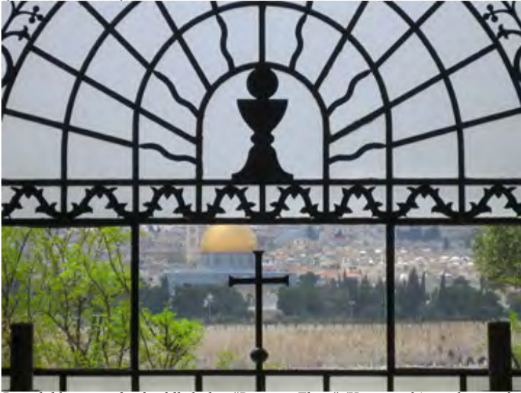
Dette bildet er tatt fra den lille kirken "Dominus Fleuit" (Herren gråt) som ligger i åssiden opp mot Oljeberget i Jerusalem.