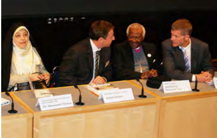
Fra venstre: Ms. Massoumeh Ebtekar fra Iran, direktør i UNEP Achim Steiner, Desmond Tutu og utviklingsminister Erik Solheim.

av Gro Harlem Brundtland, statsminister Jens Stoltenberg, direktøren i FN's miljøprogram, (UNEP) Achim Steiner og andre, deltok tidligere erkebiskop Desmond Tutu også her.