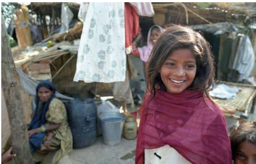
Meir enn 7.000 menneske, dei fleste dalittar, bur i slummen ved enden av rullebanen til den internasjonale flyplassen i New Delhi.