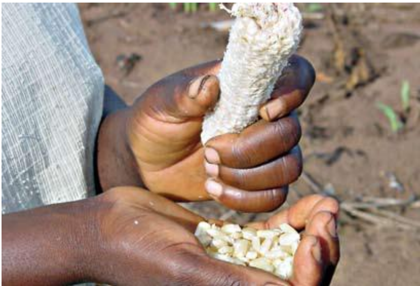
Mais er det viktigaste "daglege brød" i store deler av verda.

60-årsjubileet for den internasjonale menneskerettserklæringa (2008) er eit høve ikkje berre til å friske opp att ansvaret vårt for menneskerettane, men òg – og endå meir – til å oppdage på nytt dei trusprinsippa som ligg bak ansvaret.