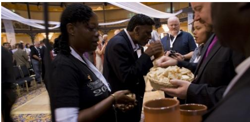
Nattverdsmåltid på LVF generalforsamling 2010.

ML = medliturg (tekstlesar, bønelesar, forsongar, nattverdsmedhjelpar osv.)