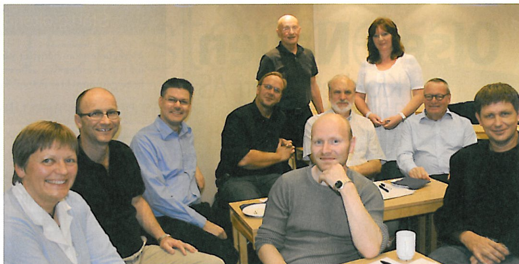
Disse skal bli Den norske kirkes eksperter på kulturstøtte.

«La oss si at historien for din konsert er at Arve Tellefsen er hovedpersonen. Det er han ofte. Men hva er unikt med hovedpersonen denne gangen? Jo, kanskje er historien at Arve Tellefsen skal spille Sjostakovitsj for første gang. Han har aldri tidligere prøvd seg på en fiolinkonsert av Sjostakovitsj. Eller kanskje han skal spille Sjostakovitsj' andre fiolinkonsert for sjette gang, men at denne framføringen etter all sannsynlighet blir siste gang han kommer til å spille dette verket. Tellefsen blir eldre for hvert år som går – vil han klare å gjennomføre konserten for aller siste gang? En må skape noen spenningspunkter. Det må være mulighet for at dette kan gå den ene eller andre veien: «I