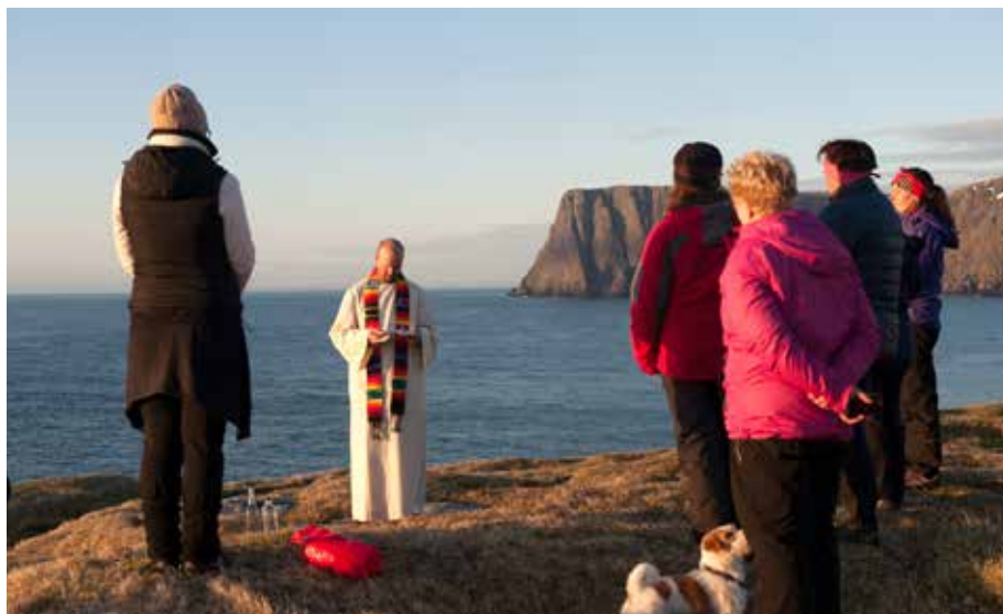
Klimapilegrim 2015 ble innledet ved bønn for skaperverket på Nordkapp i juni.

KNUT REFSDAL, Generalsekretær i Norges Kristne Råd