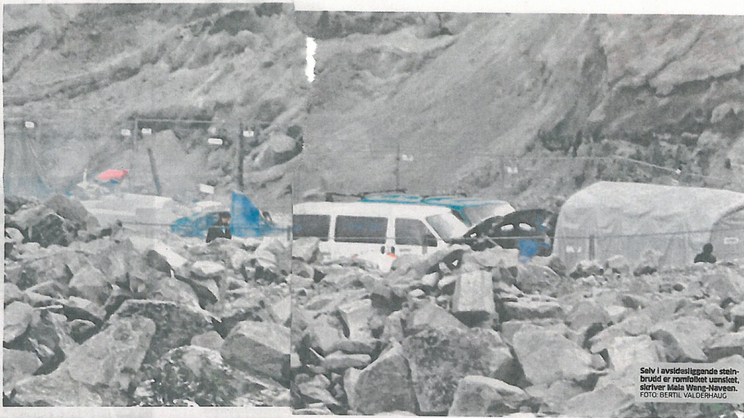
Selv i avsidessliggende steinbrudd er romfolket uansket, skriver Mala Wang-Naveen.

Romfolket. Kanskje det er på tide å slutte å undre seg over hvorfor rumenerne ikke lærer av oss. Men heller stille spørsmål ved om vi kan lære noe av dem.